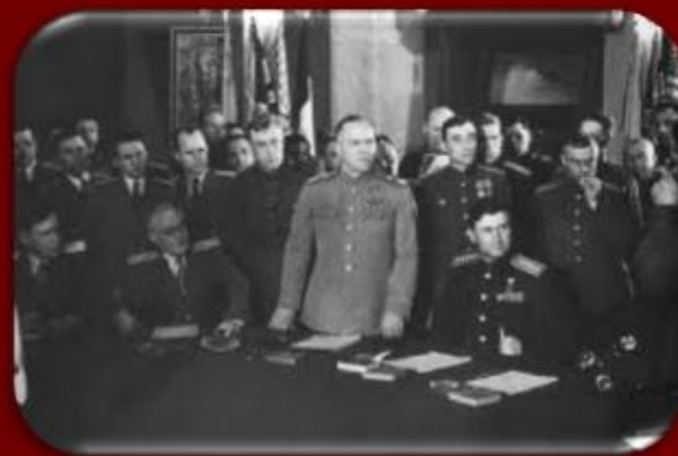
Капитуляцию Германии принял маршал Г.К. Жуков