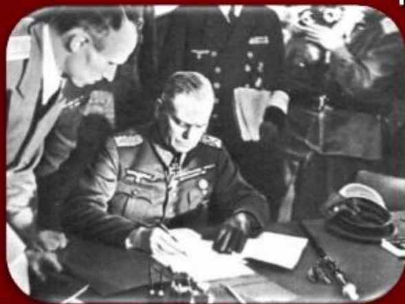
Акт о капитуляции Германии подписал фельдмаршал Вильгельм Кейтель

был подписан акт о безоговорочной капитуляции Германии, подтвердивший время прекращения огня 8 мая 1945г. в 23.01 ч. по среднеевропейскому времени.