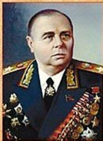
МЕРЕЦКОВ Кирилл Афанасьевич (1897 - 1968)