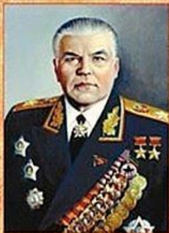
МАЛИНОВСКИЙ Родion Яковлевич (1898 - 1967)