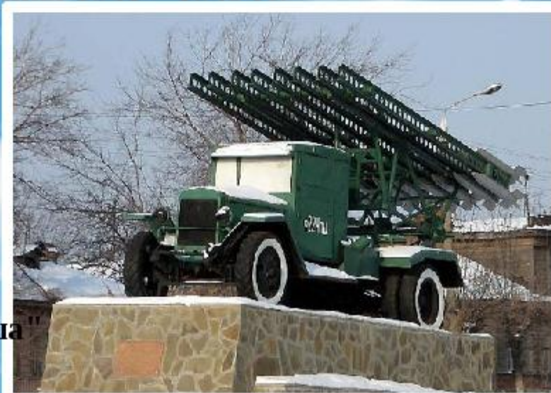
Памятник воинам- освободителям БМ-13 "Катюша"