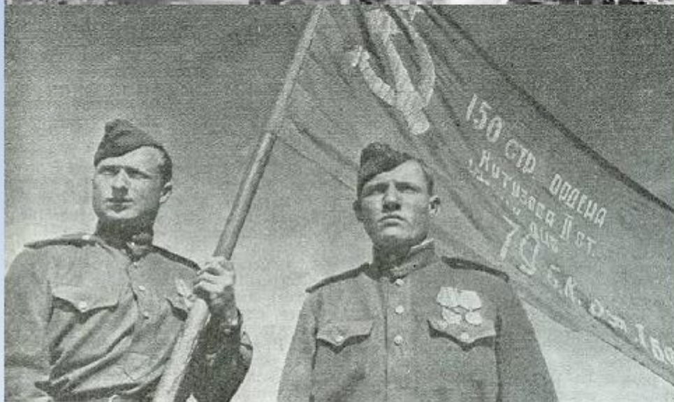
Азвездчки 756-го полка 150-й стрелковой дивизии М. А. Егоров (справа) и И. В. Кантария со Знаменем Победы. Берлин. Май 1945.