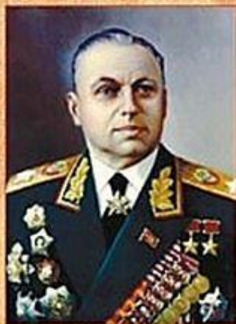
РОКОССОВСКИЙ Константин Константинович (1896 - 1968)