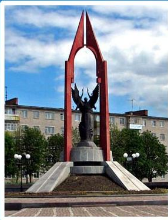
Мемориал погибшим в годы войны 1941 – 1945 гг.