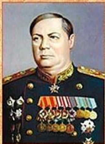
ТОЛБУХИН Федор Иванович (1894 - 1949)