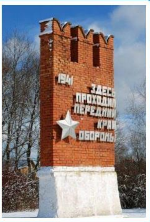
Памятный знак «Передний край обороны Тулы»