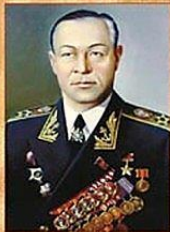
КУЗНЕЦОВ Николай Герасимович (1902 - 1974)