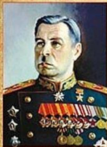
ГОВОРОВ Леонид Александрович (1897 - 1955)