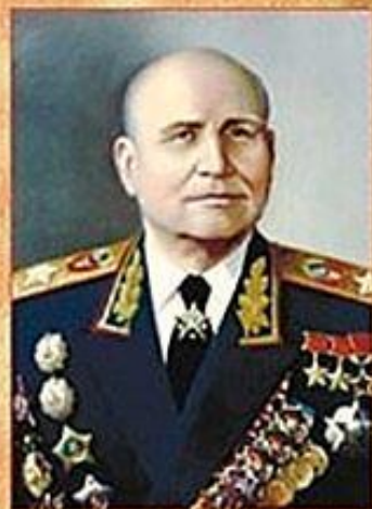
КОНЕВ Иван Степанович (1897 - 1973)