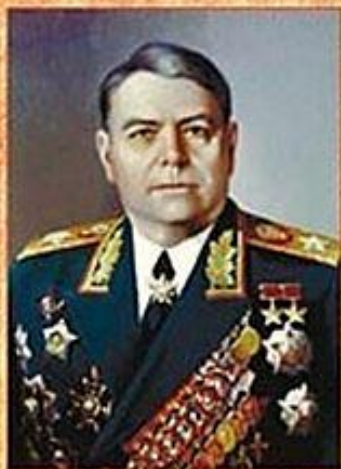
ВАСИЛЕВСКИЙ Александр Михайлович (1895 - 1977)