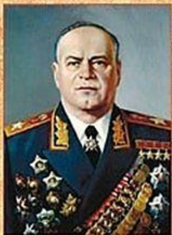
ЖУКОВ Георгий Константинович (1896 - 1974)