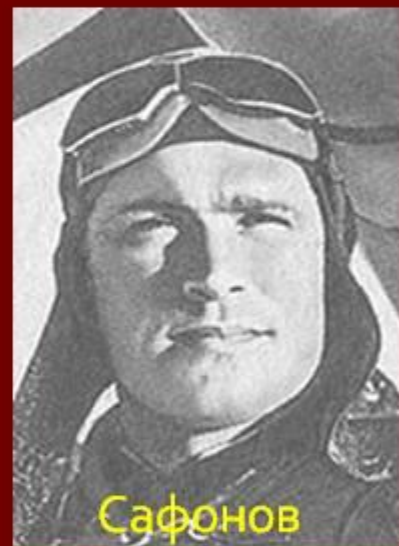
Сафонов Борис Феоктистович