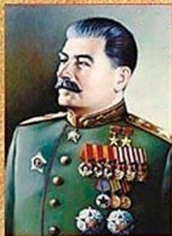
СТАЛИН Иосиф Виссарионович (1879 - 1953)