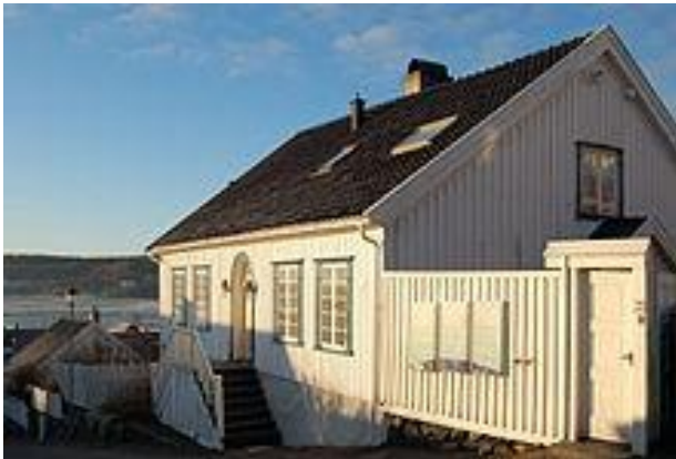
Дом в Лаврике

Тур Хейердал родился в небольшом городке Ларвик на юге Норвегии в семье Тура и Алисон Люнг Хейердал. Отец владел пивоварней. Мать работала в антропологическом музее, и юный Тур довольно рано познакомился с дарвиновской теорией эволюции. С детских лет Хейердал интересовался зоологией. В доме, где Тур проживал в те годы, он создал небольшой музей, в котором главным экспонатом была гадюка.