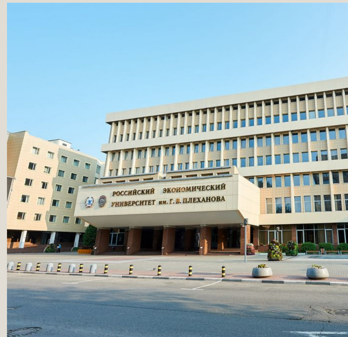
Российский экономический университет им. Г. В. Плекханова