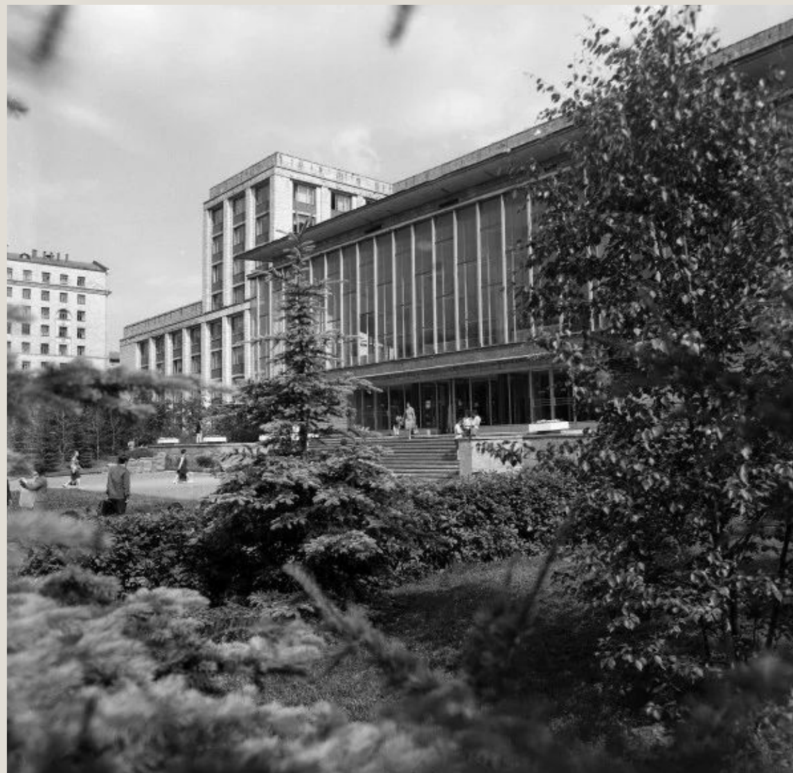
Российский государственный университет нефти и газа

В том же году закончил Московский нефтяной институт им. И. М. Губкина, В 1976 г., заочно, - Институт народного хозяйства