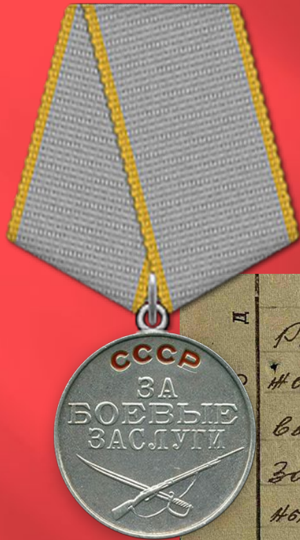
Медаль за боевые заслуги

Д Родина предан. Морально устойчив и идеологически выдержан. Грамотный офицер. Изученный опыт Отечественной войны практически применял его в боях с Японскими захватчиками. Добросовестно выполнял свои служебные обязанности. В период совершения марша показал себя выносливым, а взвод его показал организованность, дисциплинированность в совершении марша в трудных условиях Сурхотской местности. При выполнении задания командования проявил себя смелым и решительным командиром. Отдавал все свои умения и силы на выполнение поставленной задачи не считаясь ни с какими трудностями. Я Д