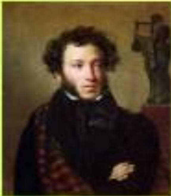
Родословная Александра Сергеевича Пушкина