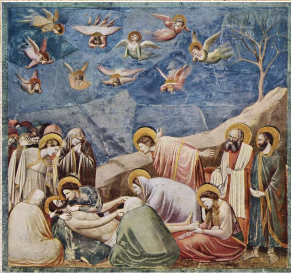
8. Художник Раннего Возрождения, фреска «Оплакивание Христа»