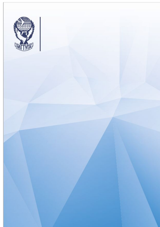
Обложка учебных пособий