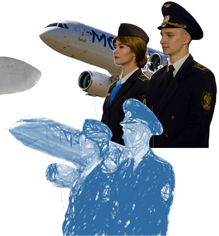
Самолёт и студенты ФАСК