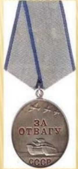
Медаль за отвагу