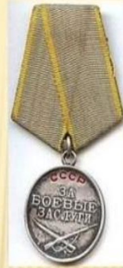
Медаль за боевые заслуги