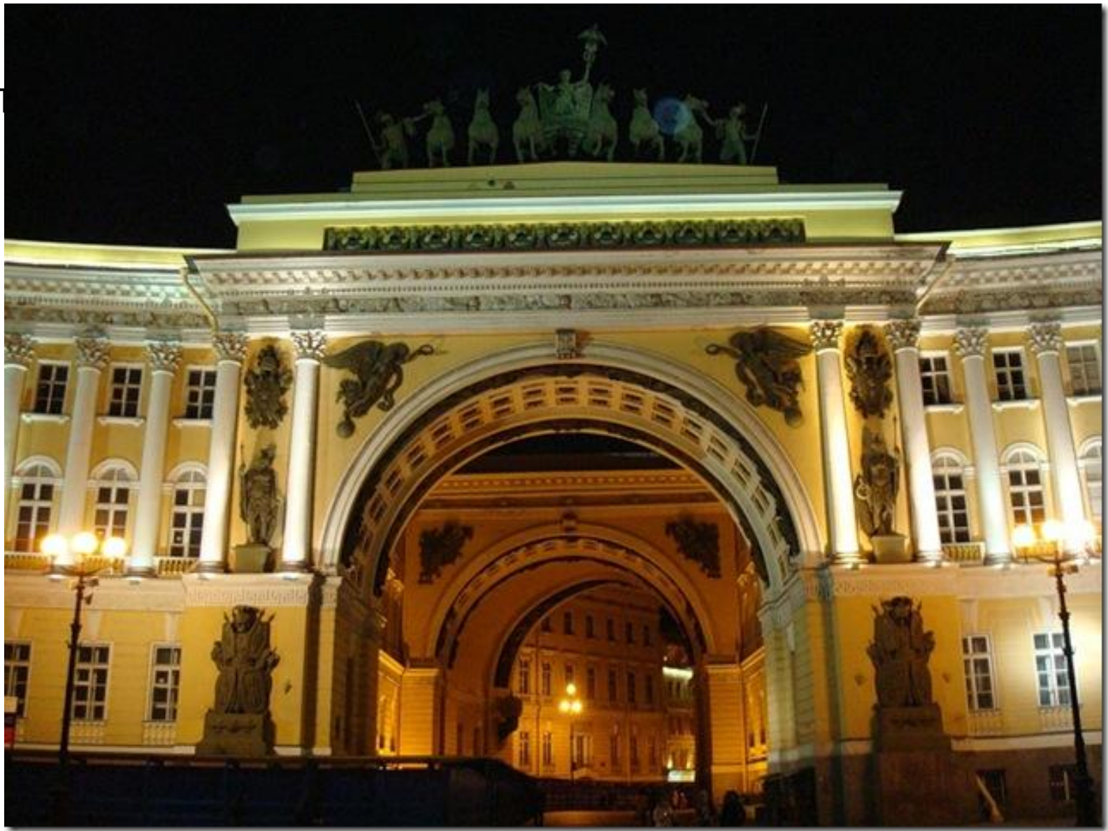
Триумфальная арка Главного штаба