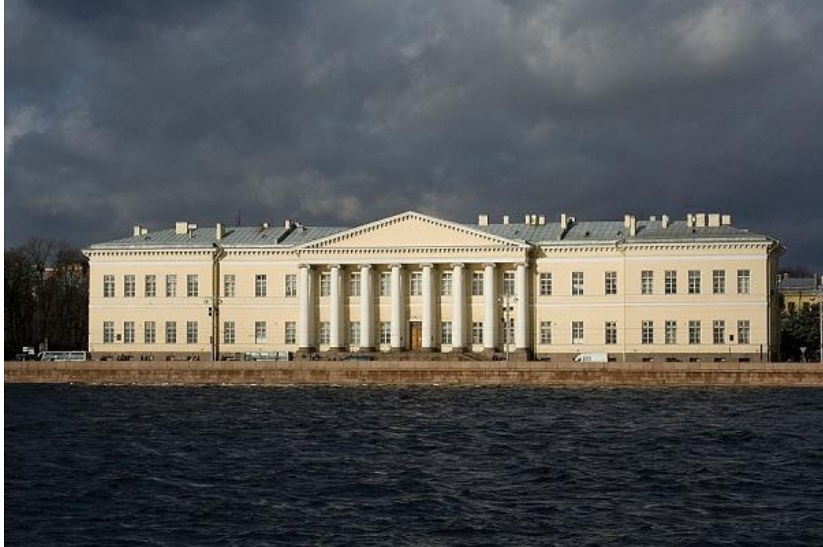
Здание академии наук