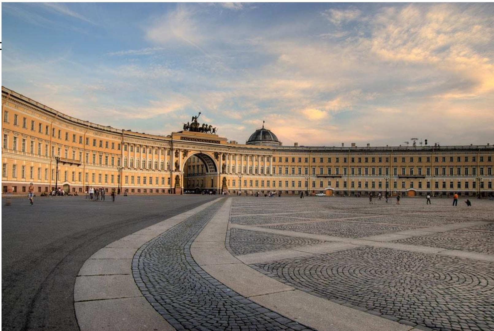
Здание Главного штаба на Дворцовой площади