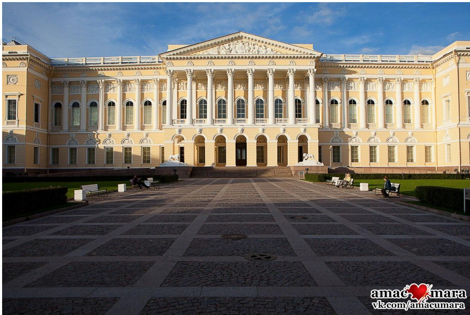
Михайловский дворец (ныне Русский музей)