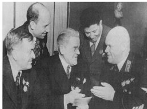
Композитор А.Александров (крайний слева)