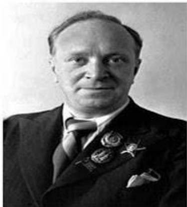
Поэт Василий Лебедев-Кумач