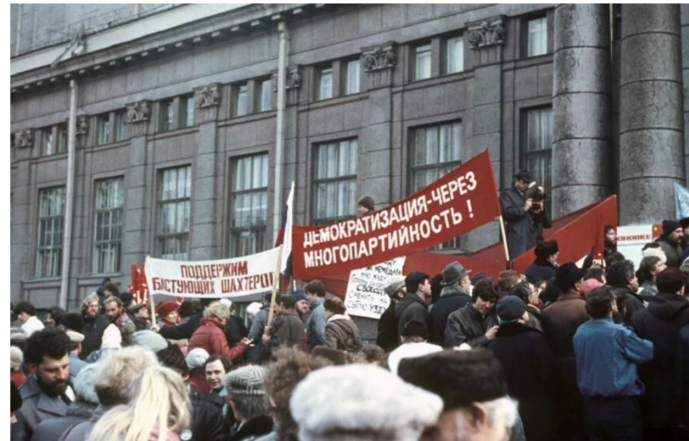
Митинг 7 ноября 1989 года в Ленинграде.

1989 год стал годом появления многих партий. Вновь образованные партии отражали все ведущие направления политической жизни.