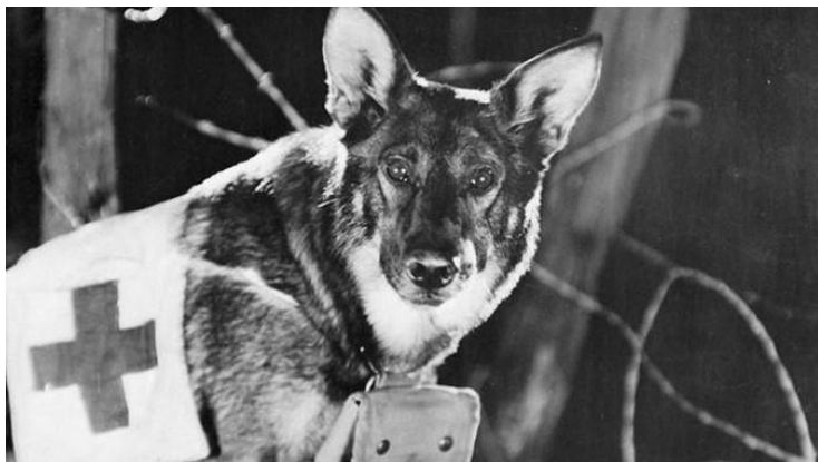
«В память о собаках» Сергей Ярошенко