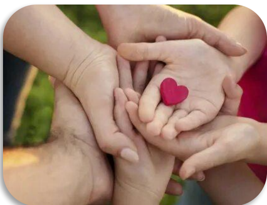
Любовь к людям.