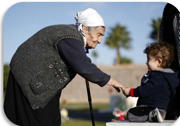
Уважение к старшим.