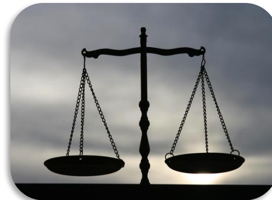
Стремление к добру и справедливости.