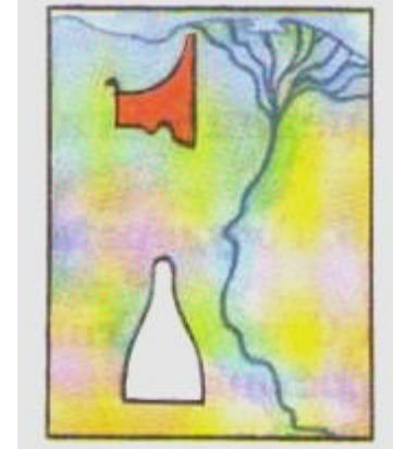
Короны царей Северного и Южного Египта