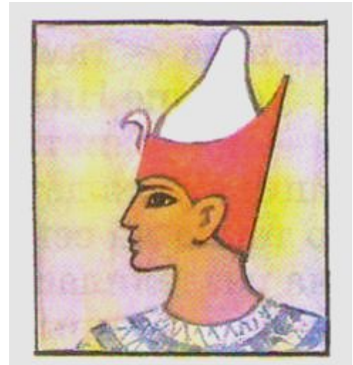
Двойная корона фараона