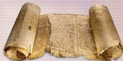
книга - свиток