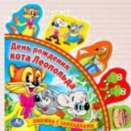
книга с закладками