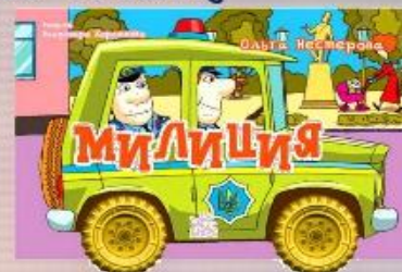
книга с «колесами»