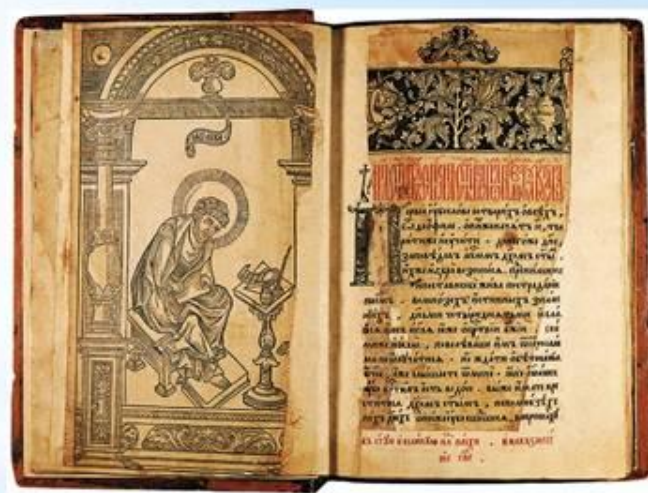
Первая печатная книга