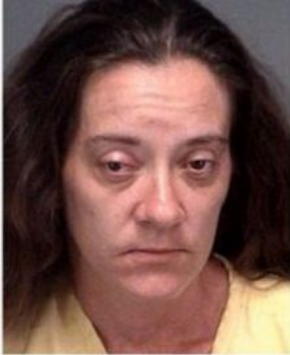
2 AGE: 37