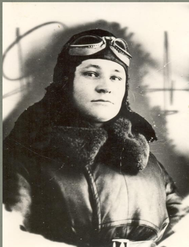
ЗДОРОВЦЕВ Степан Иванович

Первым в истории Великой Отечественной войны в воздушном бою под Ленинградом он совершил ночной таран самолета противника, винтом своего бомбардировщика он срезал хвост немецкому Юнкерсу. За этот подвиг он одним из первых был удостоен званием Героя Советского Союза.