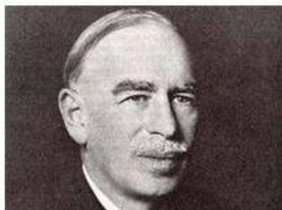
Дж.М. Кейнс 1883-1946