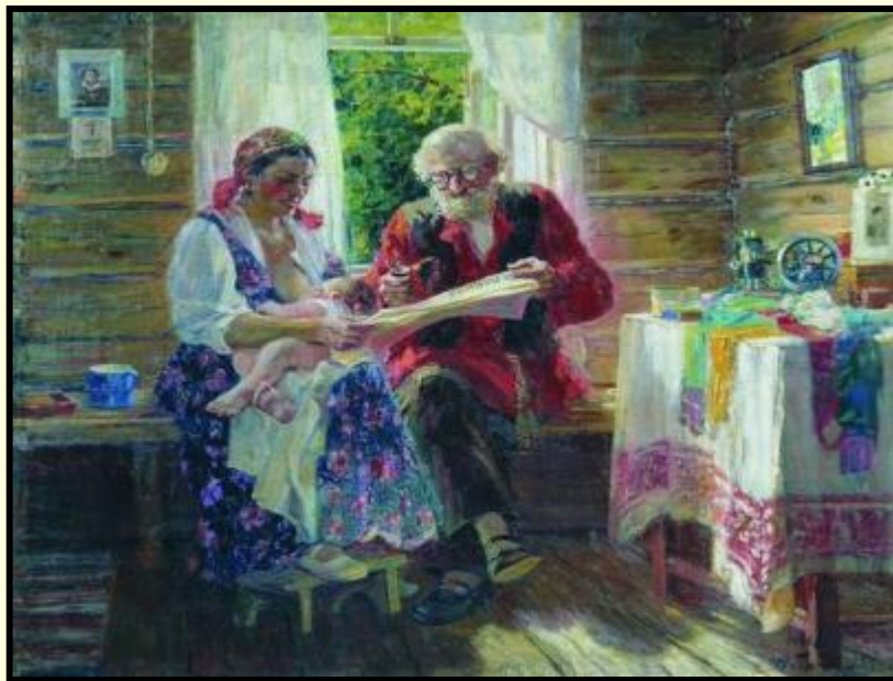
«Вести с целины»