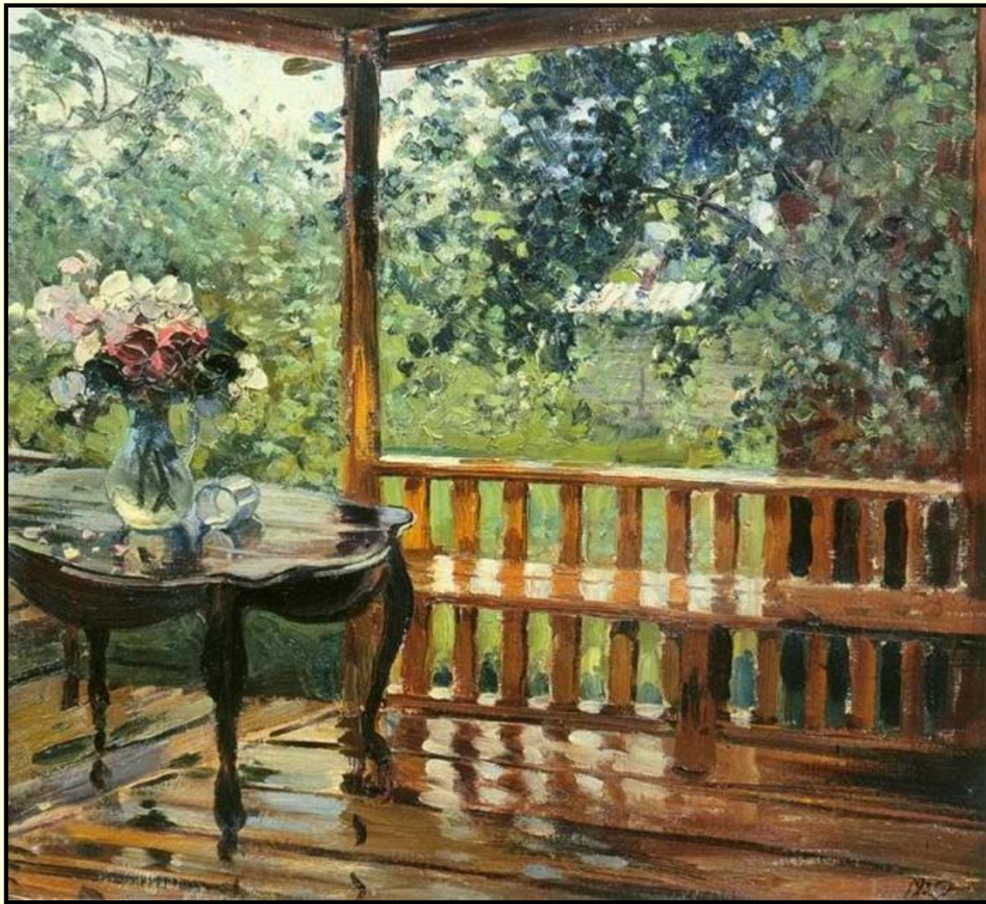
«После дождя» («Мокрая терраса»)