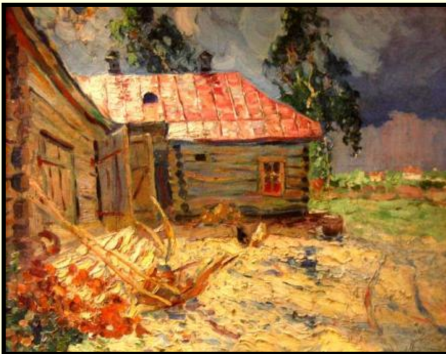
«Домик в Панском»