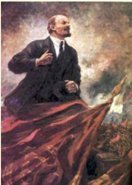
«В.И.Ленин на трибуне»