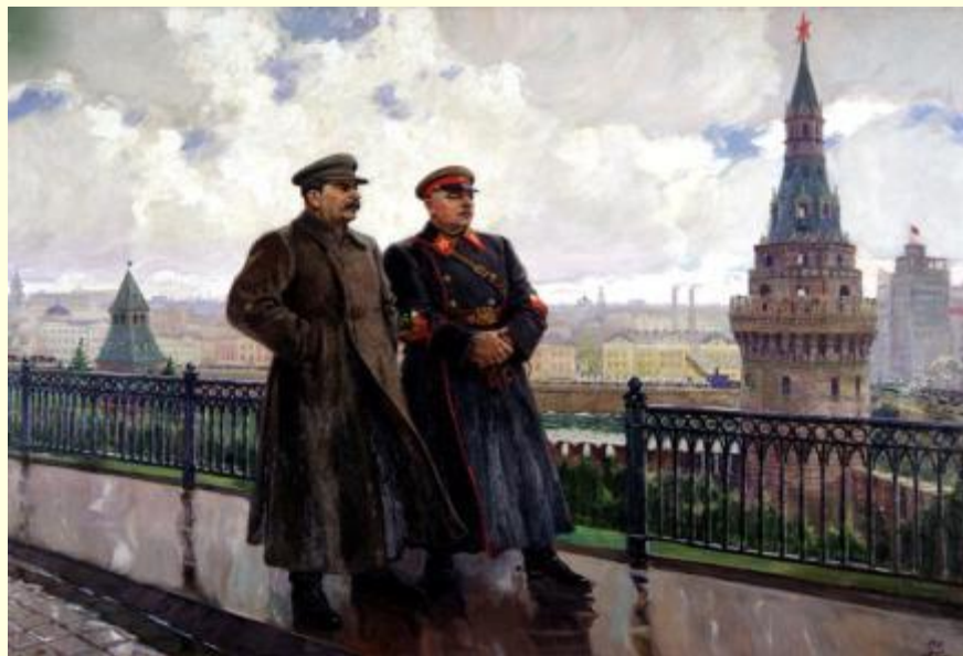
«И.В.Сталин и К.Е.Ворошилов в Кремле»