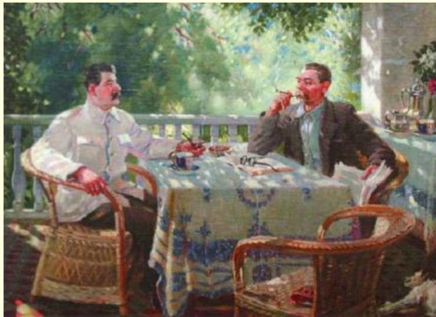
«И.В.Сталин и А.М.Горький на даче»