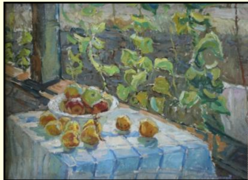
«Яблоки на столе»