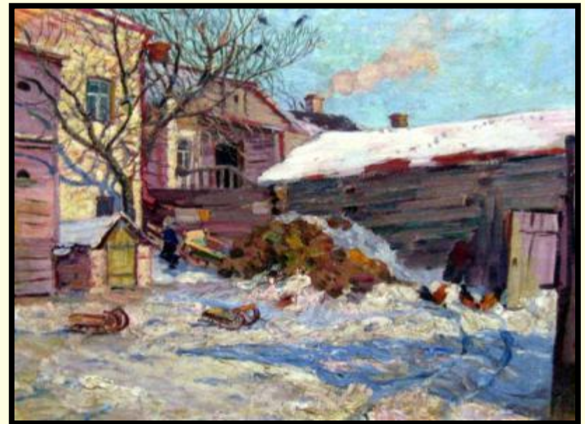
«Домик в Козлове»