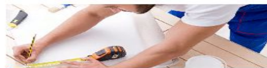
Строительные работы и ремонт