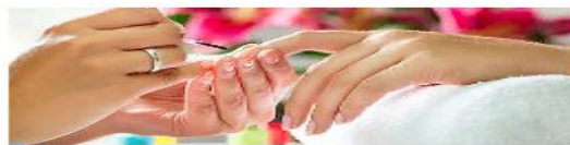
Оказание косметических услуг на дому