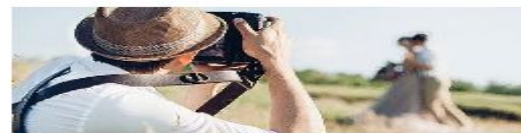
Фото- и видеосъемка на заказ