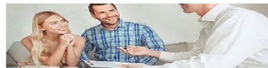
Сдача квартиры в аренду посуточно или на долгий срок