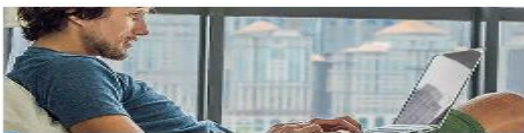
Удаленная работа через электронные площадки