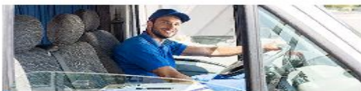
Услуги по перевозке пассажиров и грузов