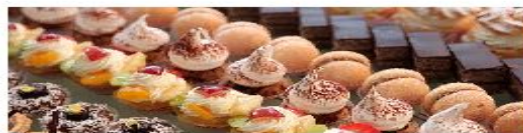
Продажа продукции собственного производства