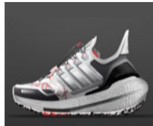
ULTRABOOST 21 GTX