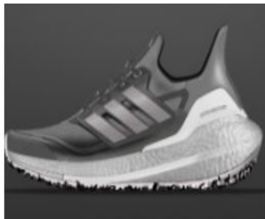
ULTRABOOST 21 C. RDY