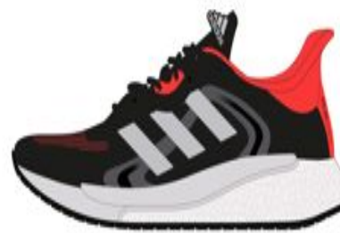
SOLARGLIDE 4 ST