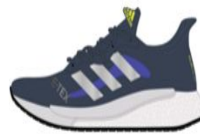
SOLARGLIDE 4 GTX