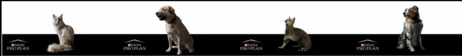
наклейка универсальная на 4 окна (обрезается под любой размер окна) Размер 4150x500 мм