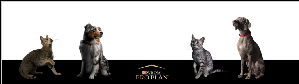
наклейка универсальная на ресепшн (обрезается под любой размер ресепшн) Размер 2300x600 мм