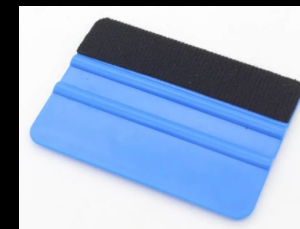
Ракельный нож для наклейки наклеек, входит в комплект. Материал: пластик с фетром