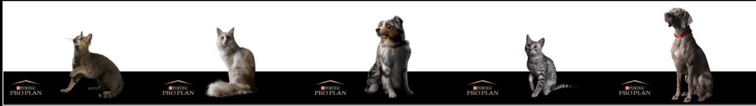
наклейка универсальная на 5 дверей (обрезается под любой размер двери) Размер 4750x600 мм