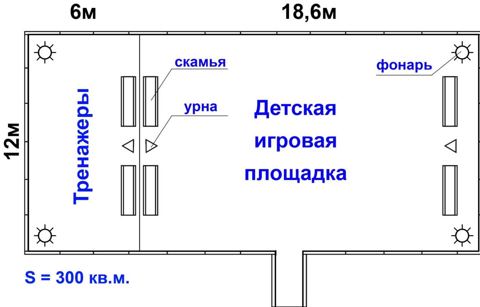
СХЕМА детской игровой и спортивной площадки