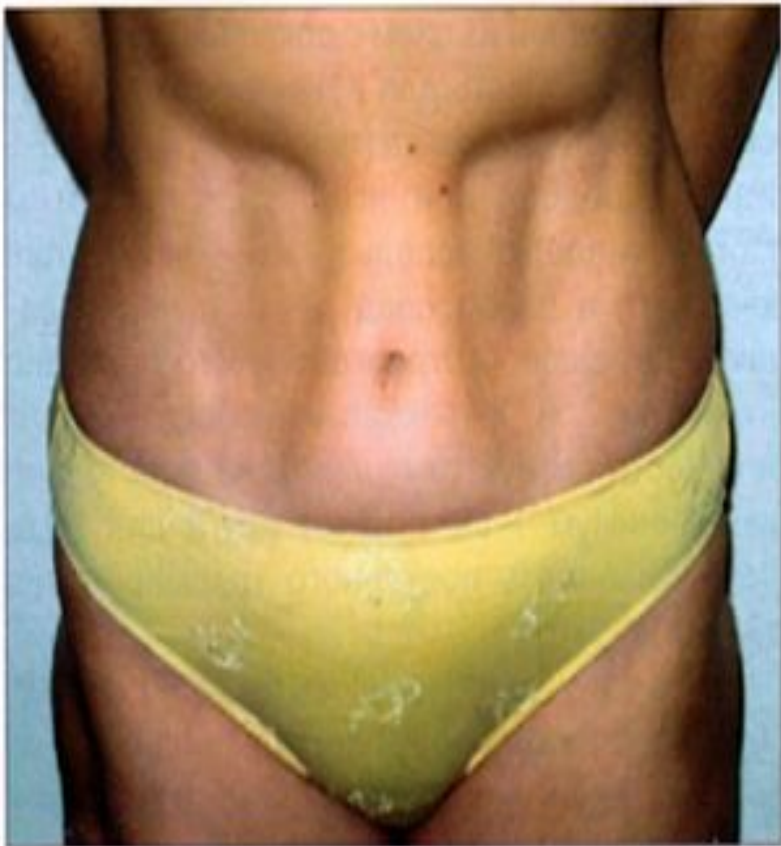
Рис. 1. Пример липоатрофии в области живота