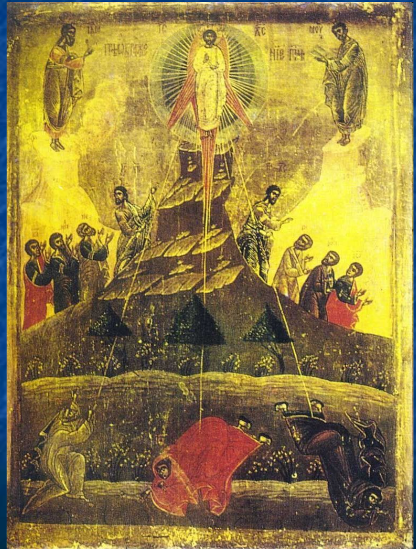
Румыния. XVI век