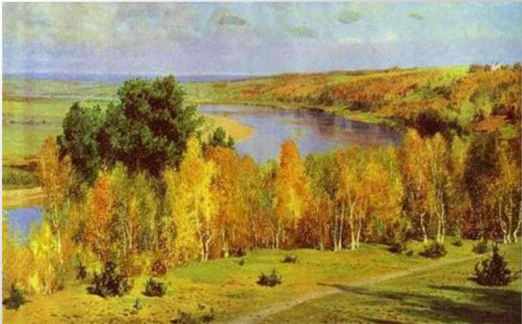
В.Поленов «Золотая осень»