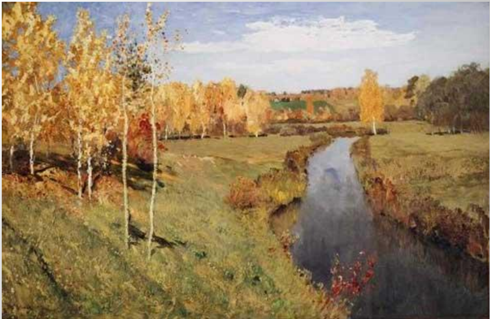
И. Левитан «Золотая осень»