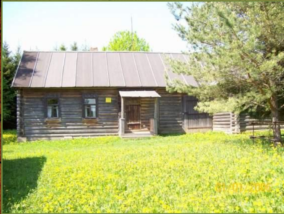
Дом Александра Трифоновича в Смоленской области. (После реставрации)

Родился на Смоленщине. С детства познакомился с русской классикой. В 1922 г. заканчивает четыре класса. С 1924 г. посылает в местные газеты заметки.