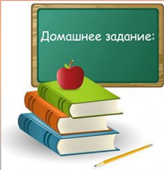
Фото всех выполненных заданий высылайте мне в личных сообщениях!