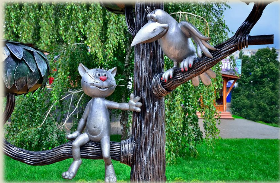
Памятник котенку с улицы Пизюкова