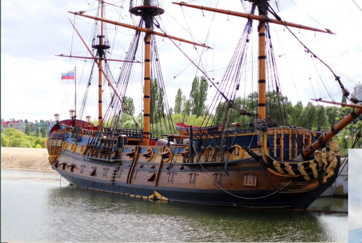
Копия корабля «Гото Предестинация»