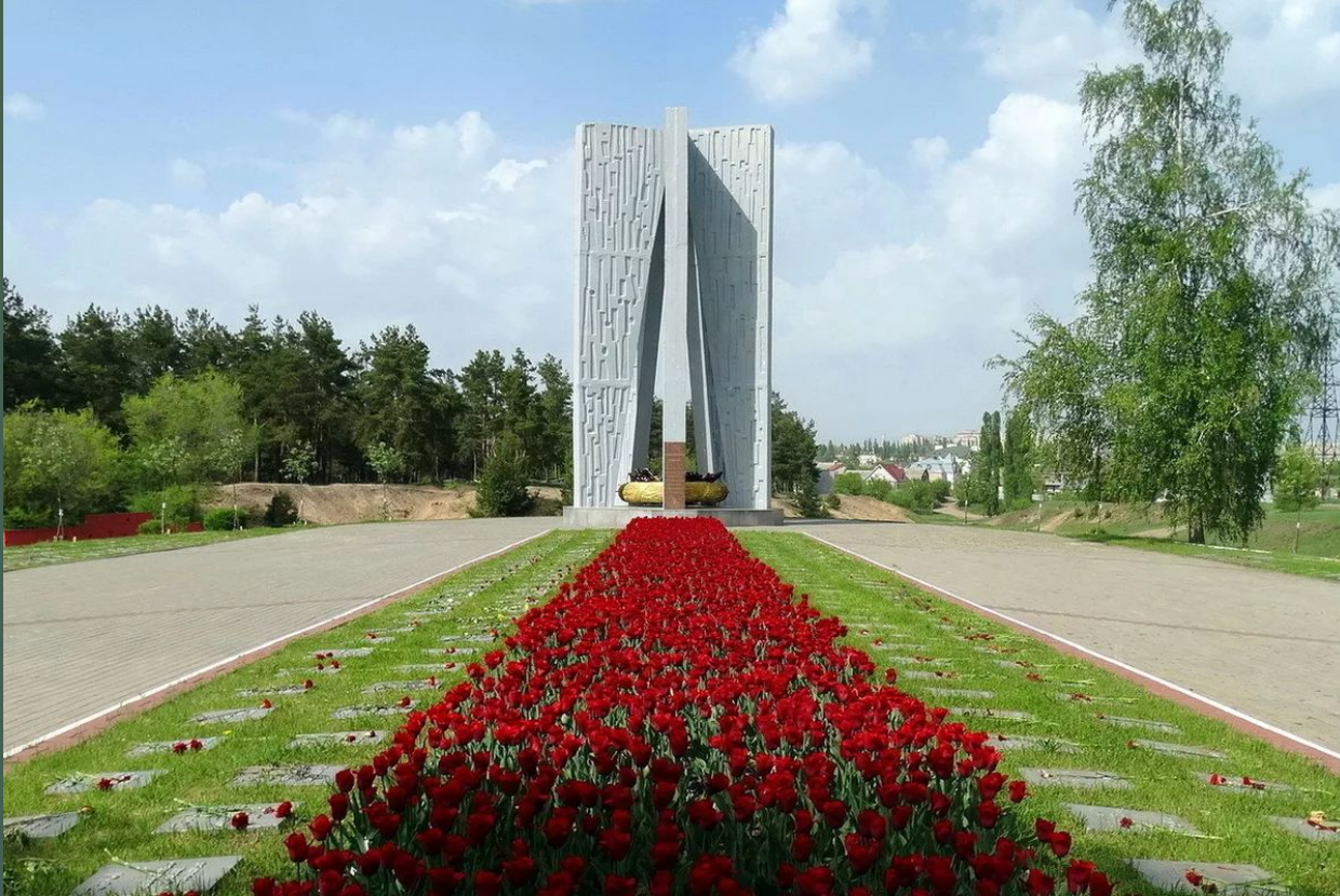
Мемориал «Песчаный лог»