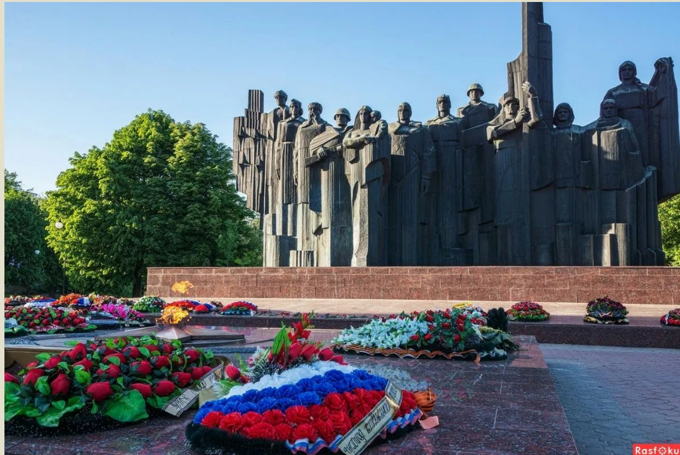
Мемориал «Вечный огонь»

Я горжусь, что на нашей земле жили отважные люди, которые не побоялись умереть за свободу своего Отечества!