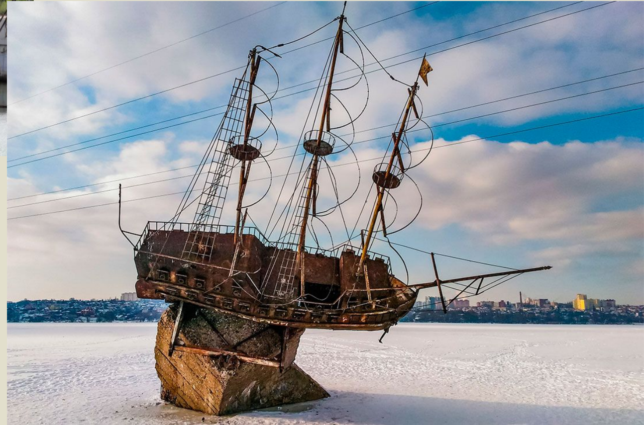
Макет корабля «Меркурий»