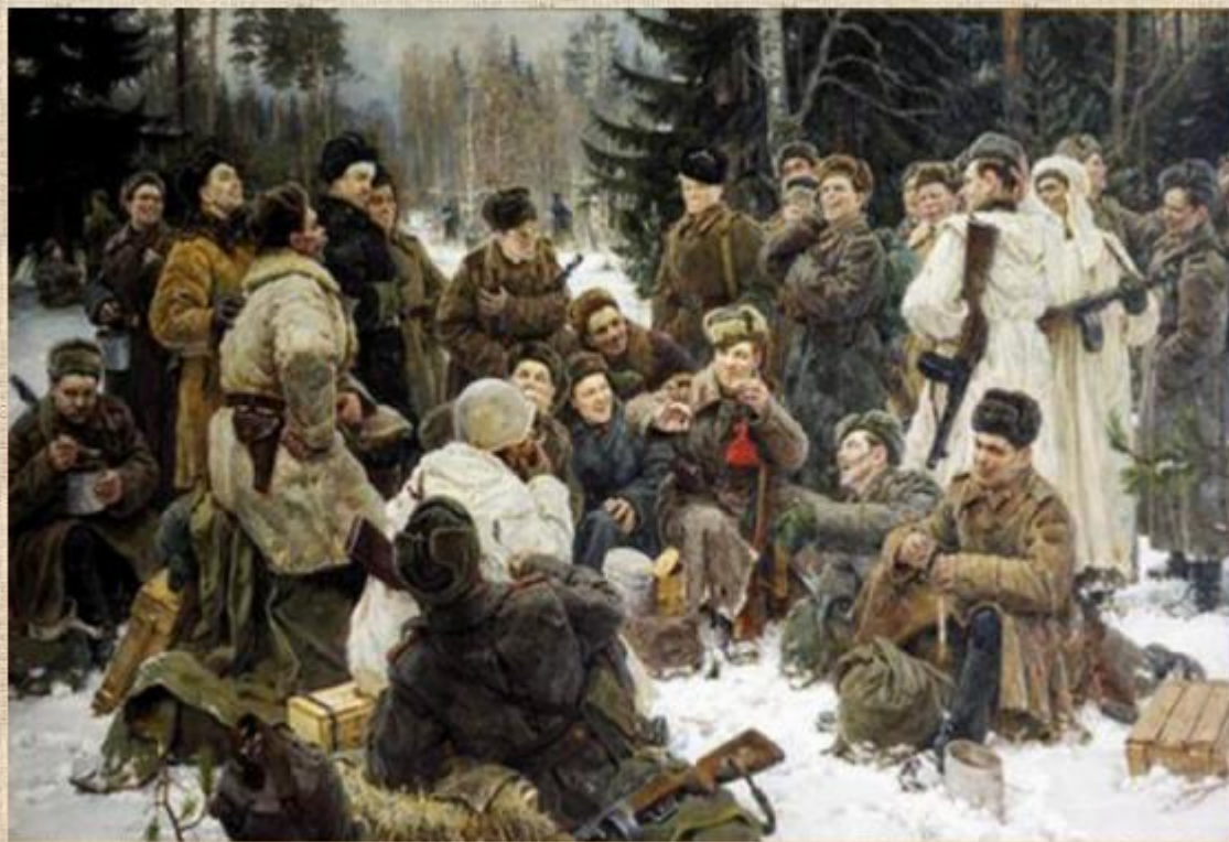
«Отдых после боя». Ю. Непринцев