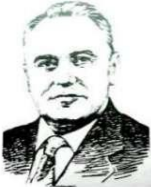
С. П. Королев