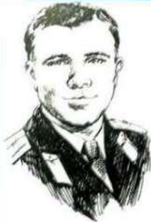
Ю. А. Гагарин

Самые большие достижения в области покорения космоса принадлежат нашей стране-России.