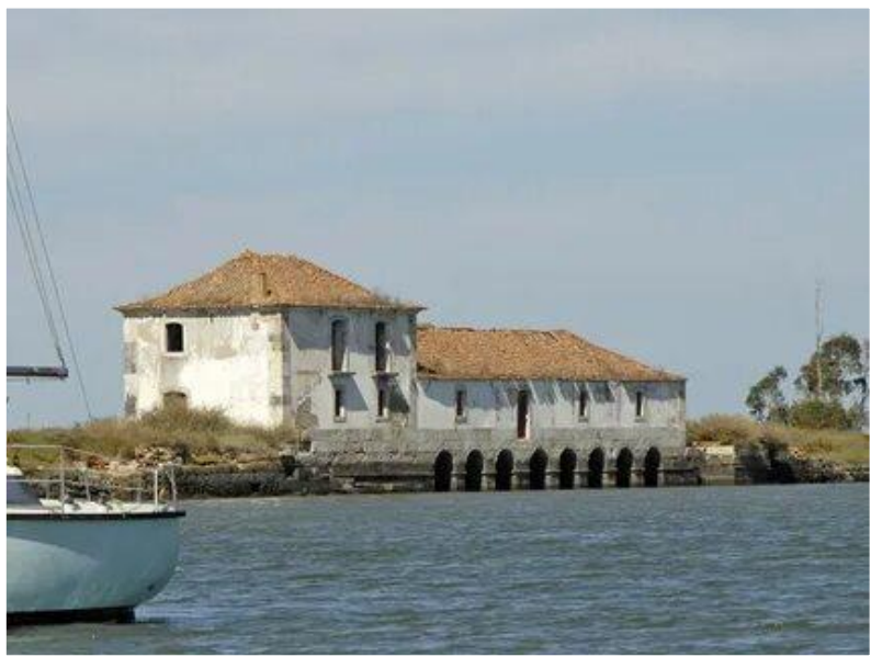
Муниципальный музей Сейшала, Португалия. 1984 г.