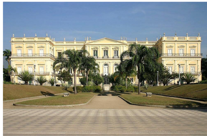
Музей Сан-Кривоао в Рио-де- Жанейро.