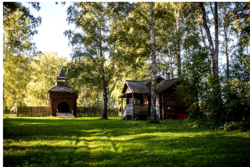
Тюльберийский городок, Кемеровская обл.