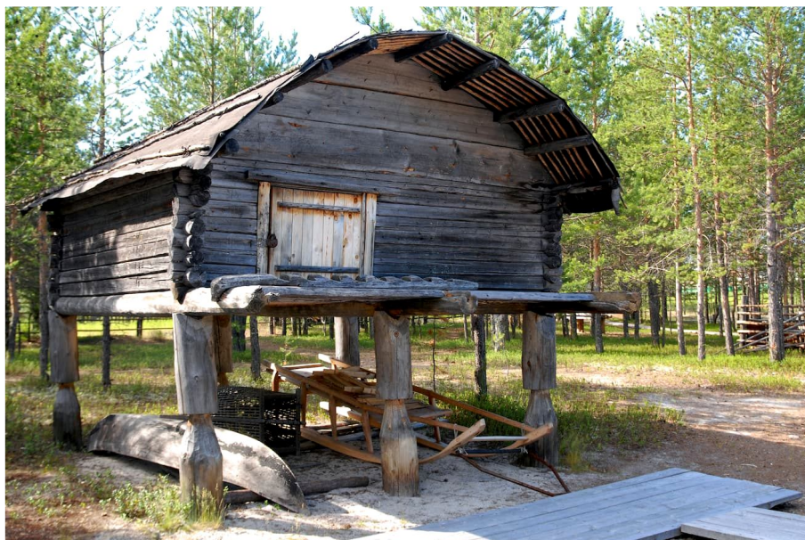
пос. Варьеган Ханты-Мансийского АО, 1986 г.