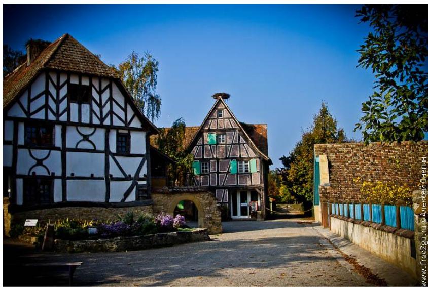
Экомузей Сен-Деган, Бретань, Франция