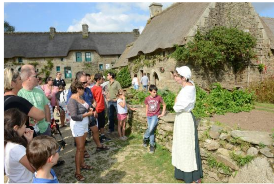
Фольклорная деревня Пул-Фетан, Бретань, Франция