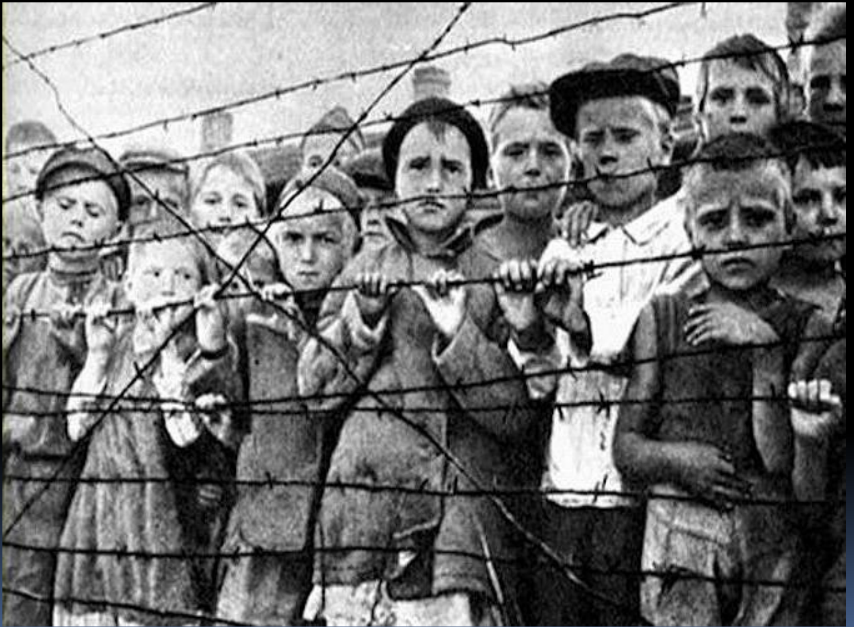
Концлагеря для мирных людей и для солдат