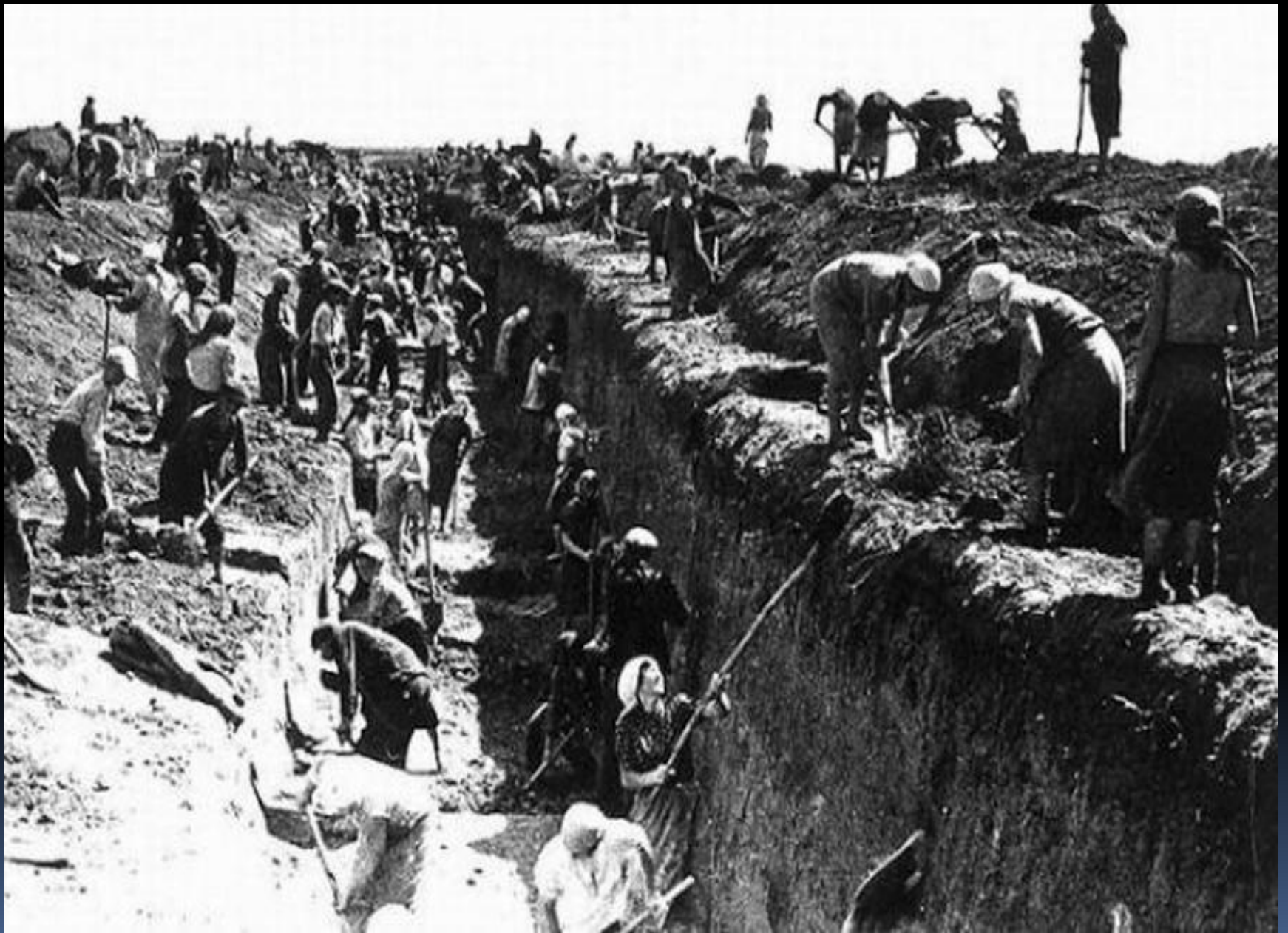
Изнурительный, тяжелый труд