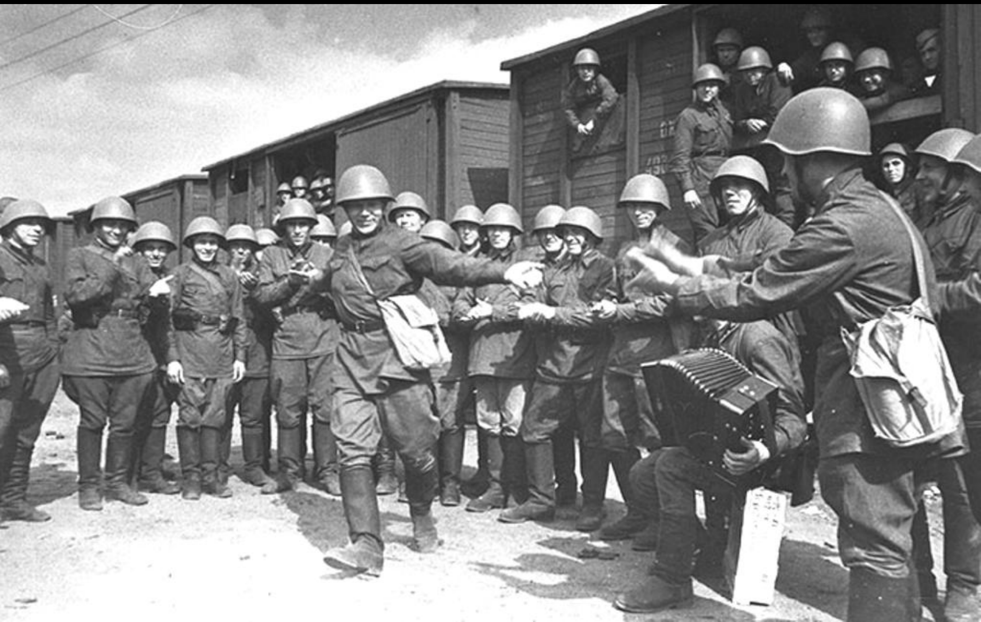
Короткие минуты отдыха