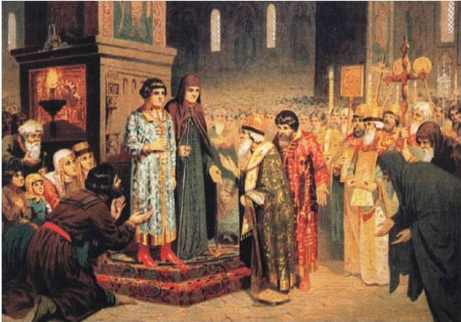
«Избрание Михаила Федоровича Романова на царство» художник -Алексей Кившенко