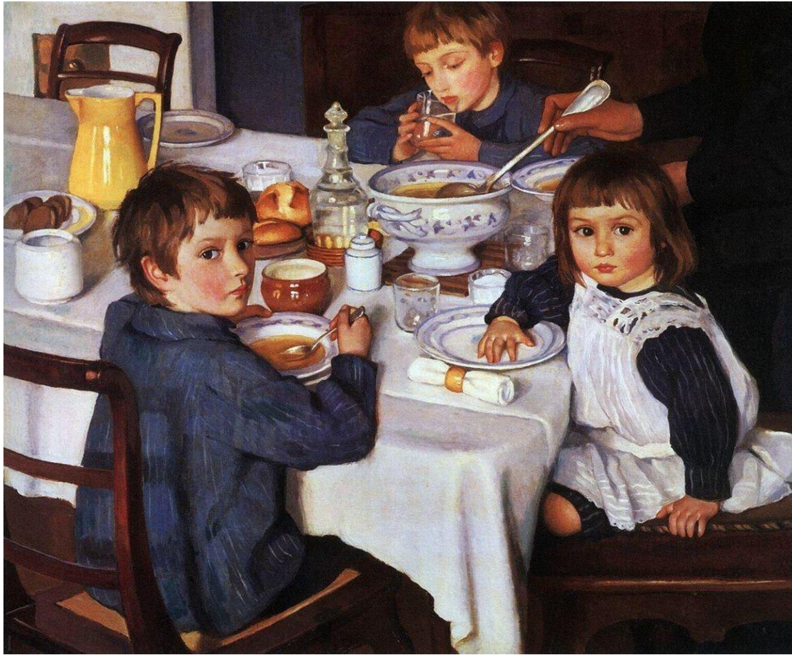
Зинаида Серебрякова ЗА ОБЕДОМ

Картины, повествующие о ежедневных историях жизни и буднях людей называются бытовыми .