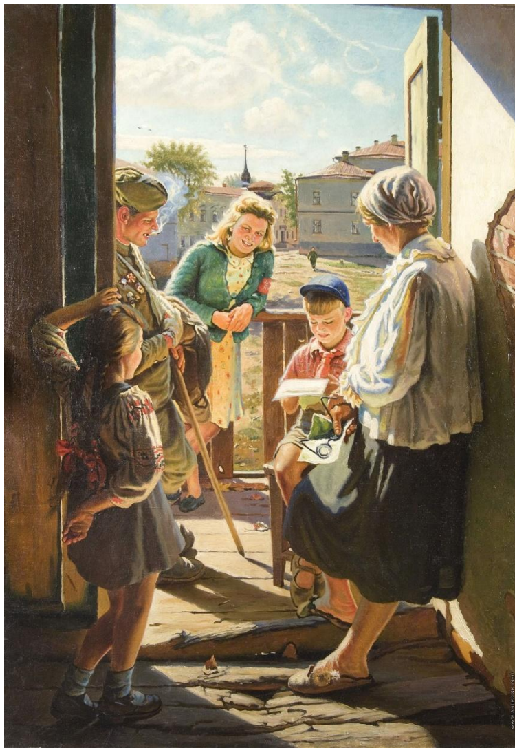
А. Лактионов ПИСЬМО С ФРОНТА