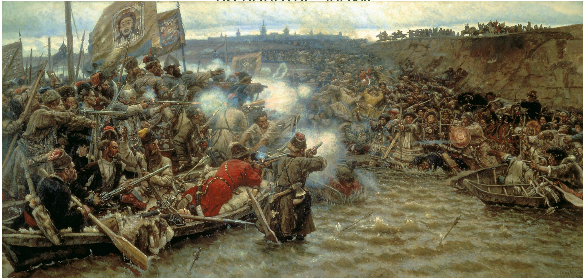
Василий Суриков ЗАВОЕВАНИЕ СИБИРИ ЕРМАКОМ

Такие картины помогают нам узнавать свою историю, своё прошлое, поэтому они называются историческими . Для того, чтобы создать достоверное произведение, художнику необходимо изучить исторические документы, костюмы создаваемой на полотне эпохи