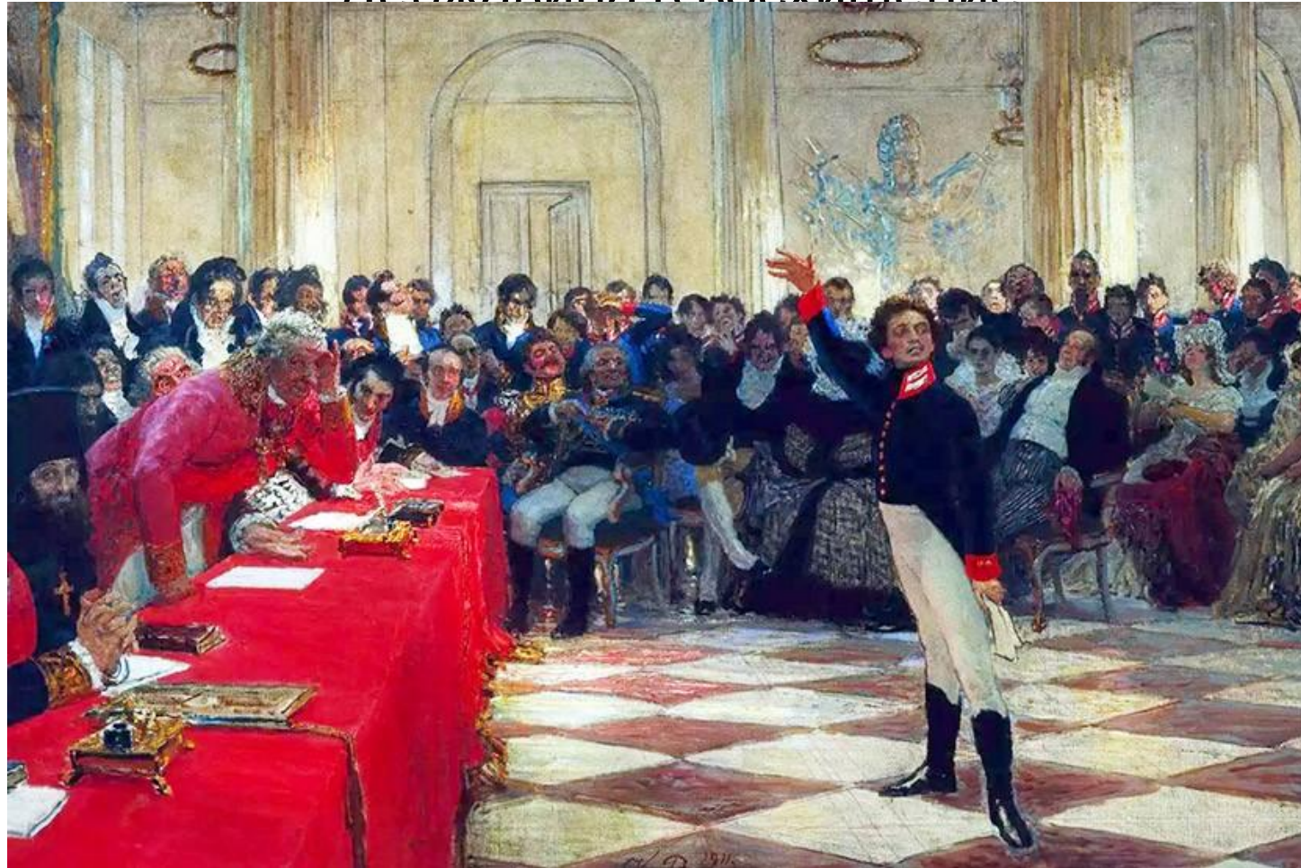
Илья Репин ПУШКИН НА ЛИЦЕЙСКОМ ЭКЗАМЕНЕ 1815 ГОДА

Известно, что Гавриилу Романовичу Державину, знаменитому поэту и государственному деятелю, было скучно присутствовать на экзаменах в Царском селе и он просто дремал, пока не начался экзамен русской словесности. Выступление молодого лицеиста Александра Пушкина привело Державина в восхищение