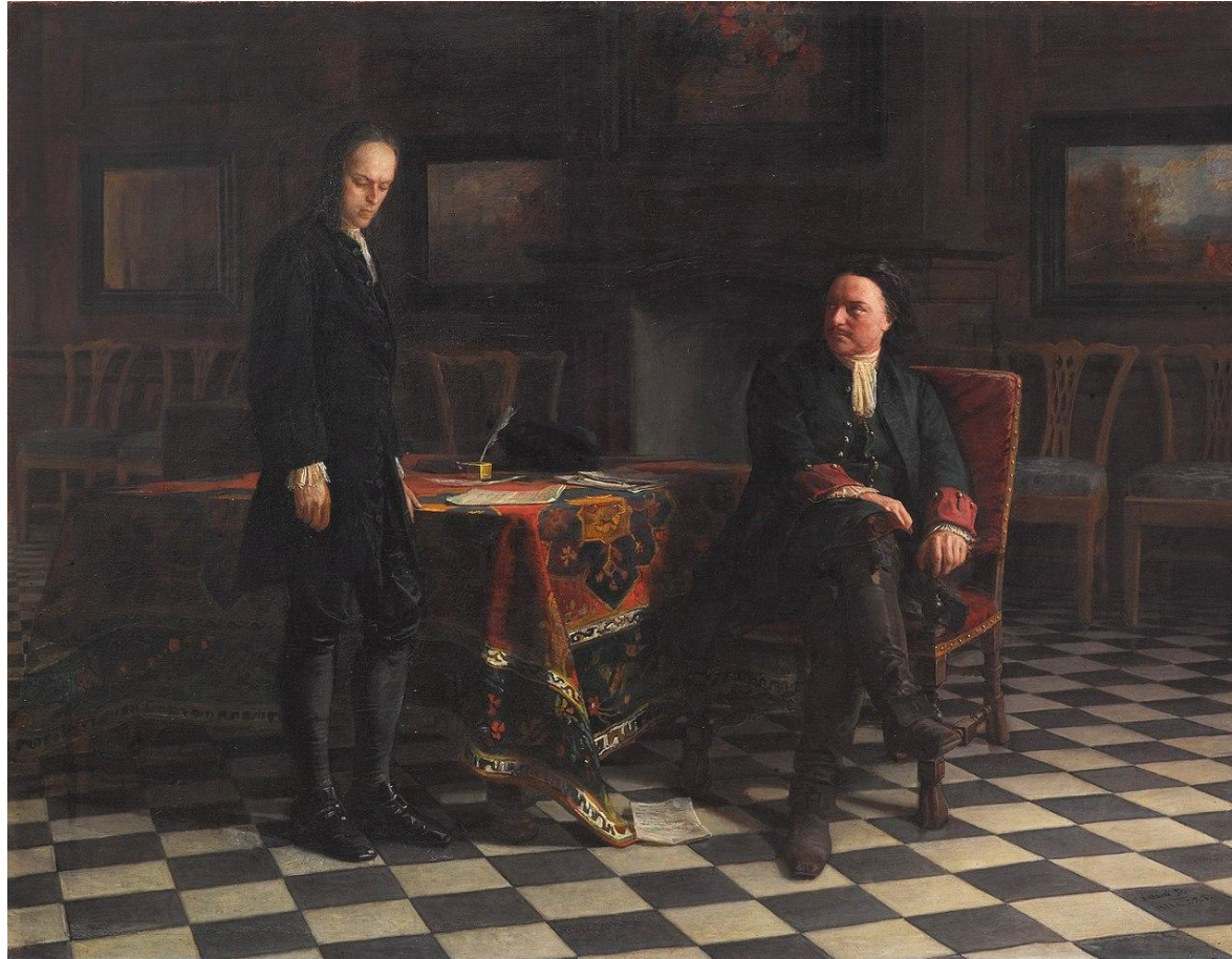
Пётр I допрашивает царевича Алексея Петровича в Петергофе.

Первоначальное идеализирование личности Петра I художником Николаем Ге изменилось в противоположную сторону после того, как он изучил исторические документы. Нельзя не признать жестокость характера царя, осудившего на смертную казнь собственного сына.