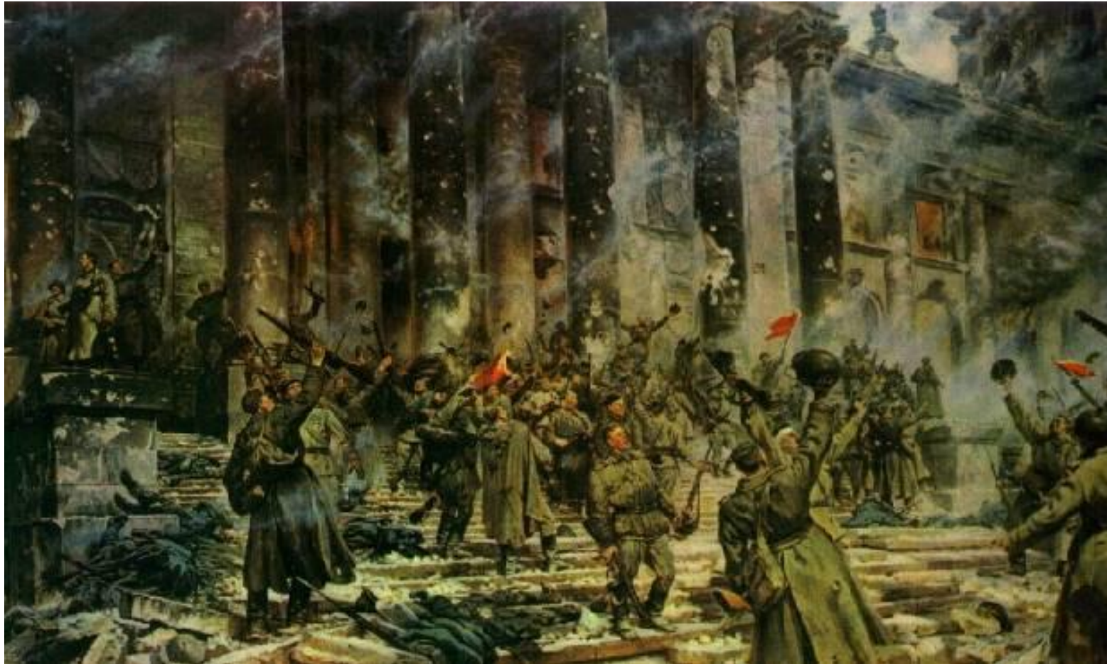
Пётр Кривоногов ПОБЕДА

Есть в музеях картины, которые рассказывают о великих событиях, важных для многих людей. Они отображают, как и где проходили памятные сражения или замечательные встречи, торжества.