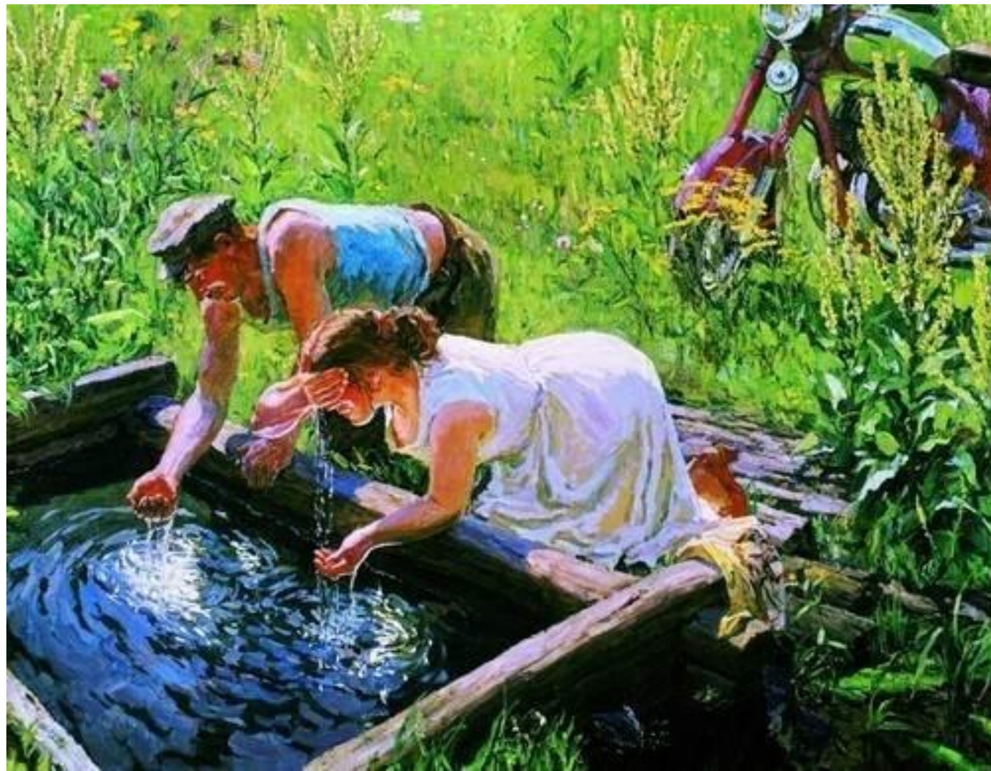
А. Пластов ПОЛДЕНЬ