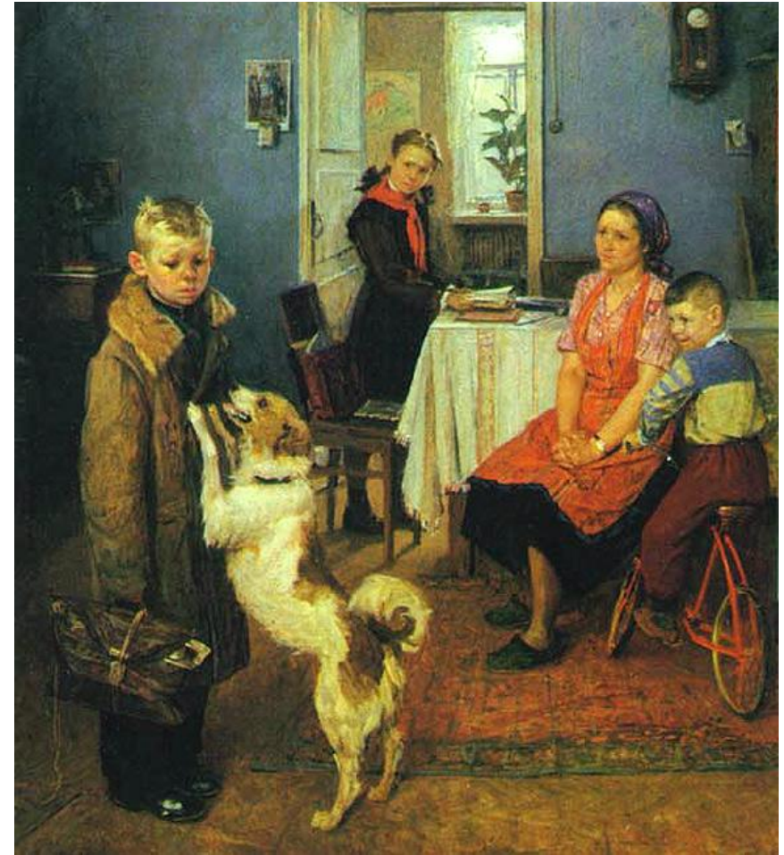
Фёдор Решетников ОПЯТЬ ДВОЙУА