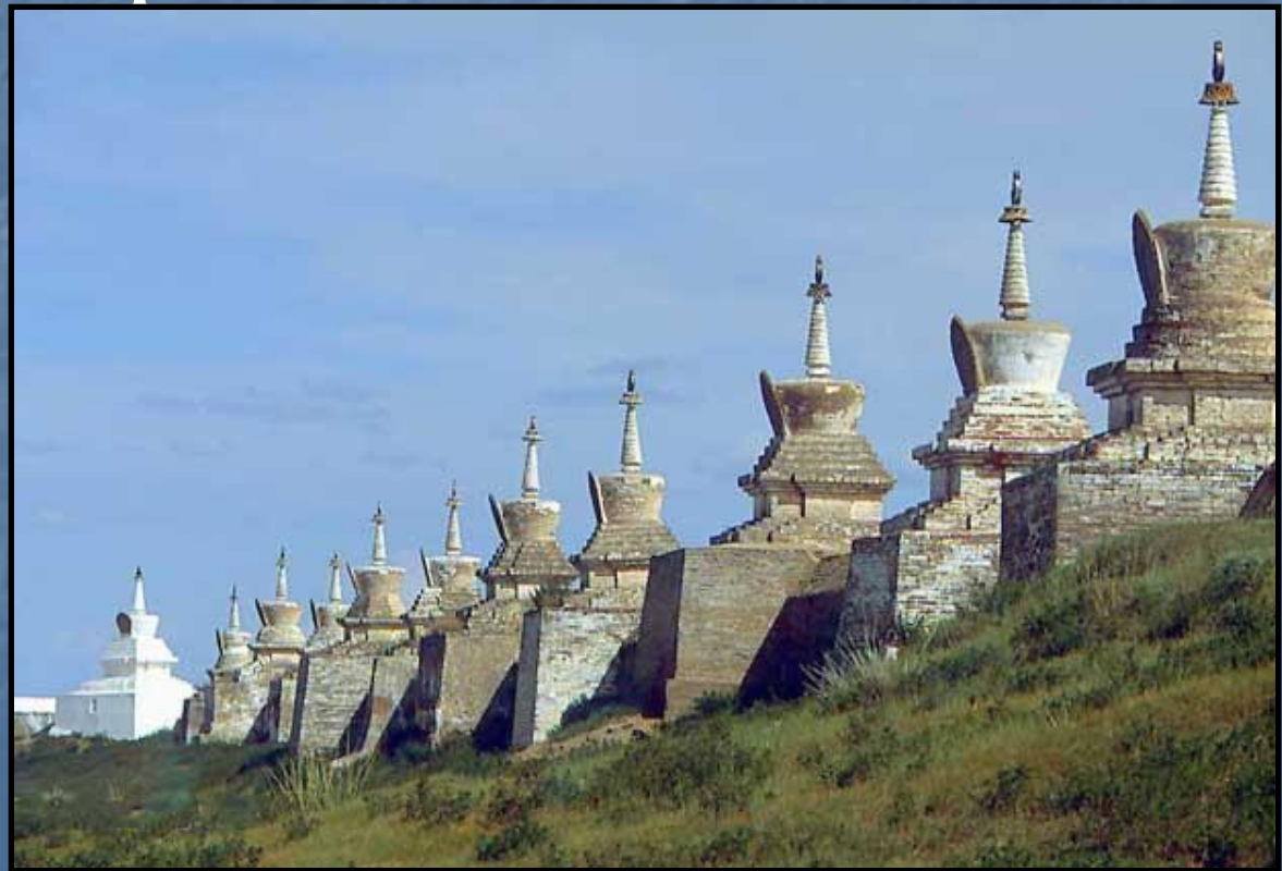
Первый буддийский монастырь Монголии Эрдэнэ-дзу