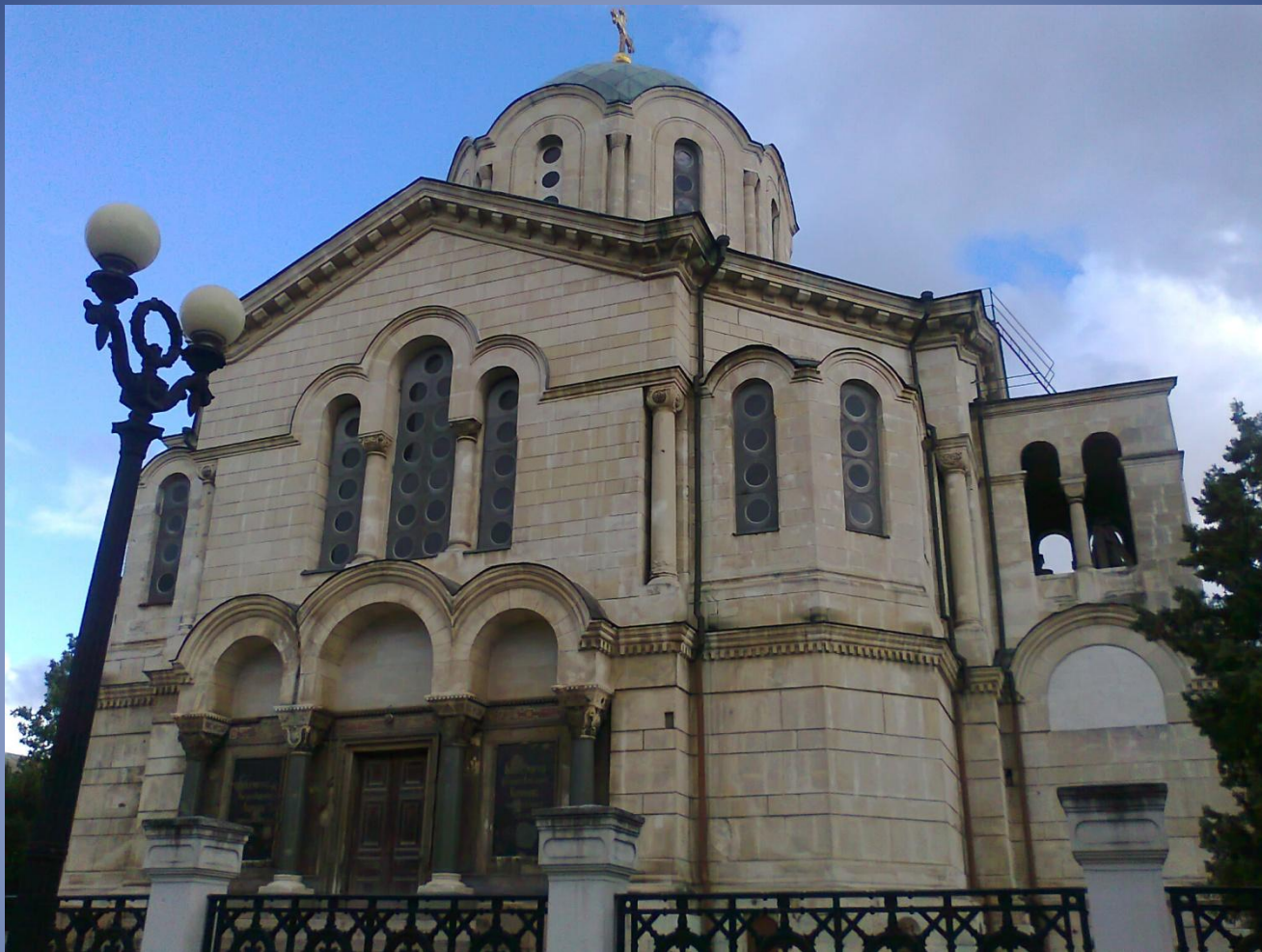
Владимирский (Адмиралтейский) собор