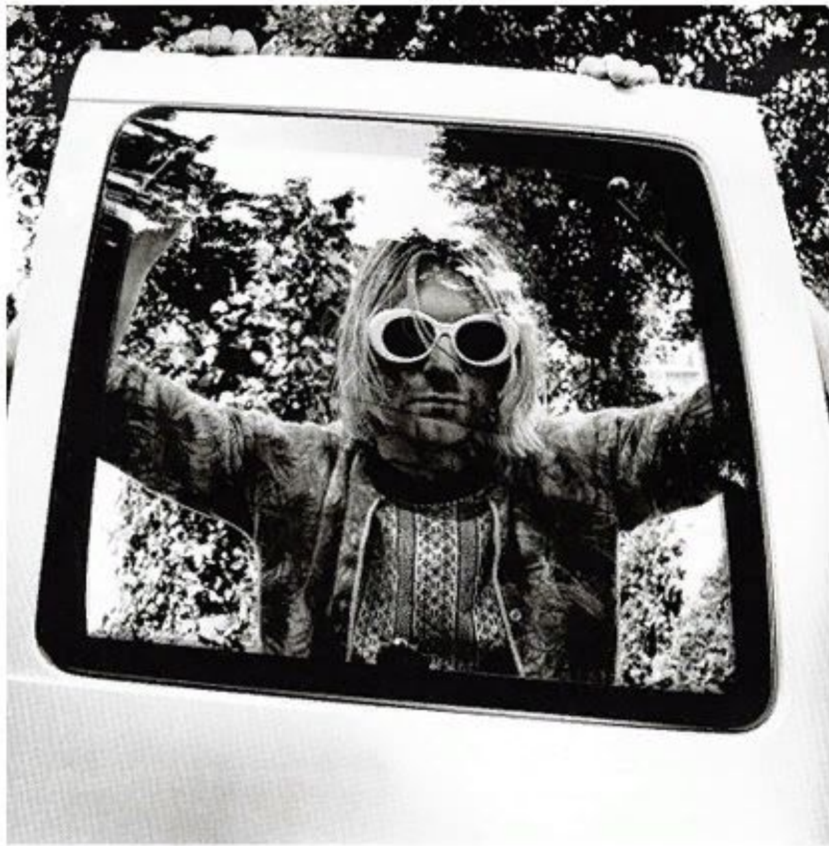
Kurt Cobain, Seattle 1993