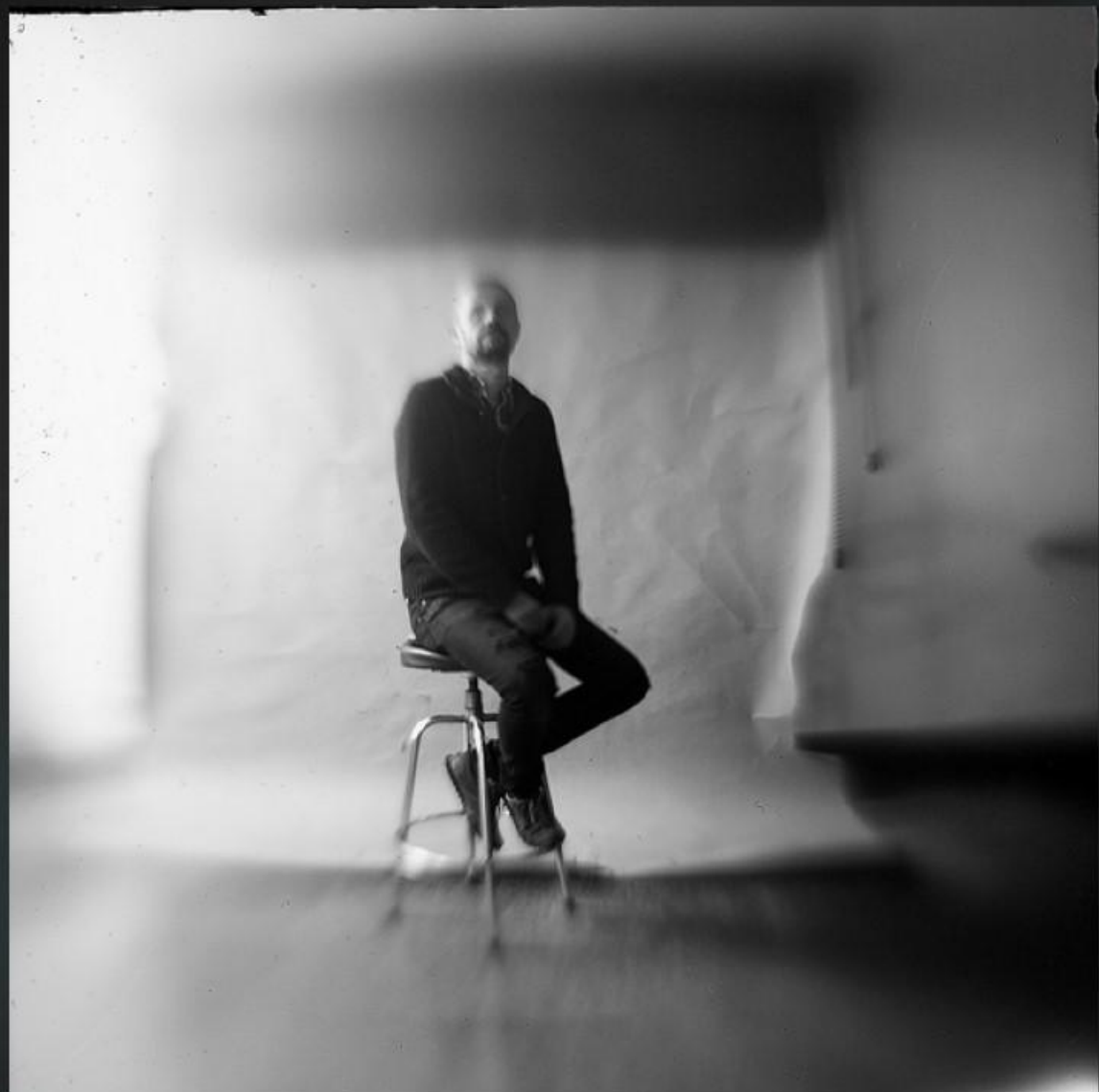
Съёмка на люмен-камеру в студии Jorge