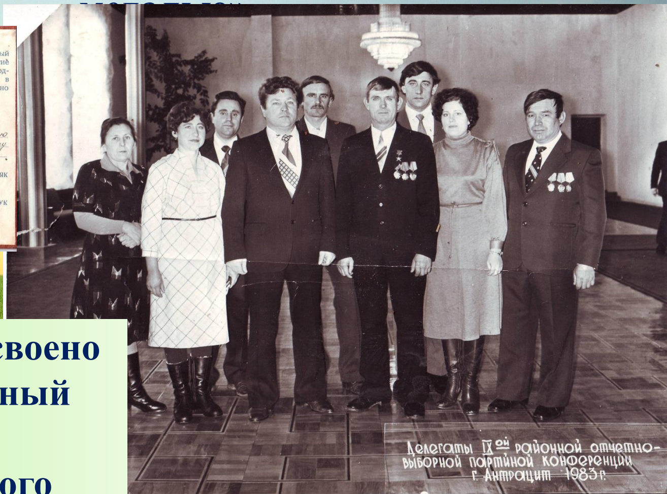
Делегаты IX районной отчетно-выборной партийной конференции г. Антрацит 1983 г.

В 1974 году присвоено звание «Почётный хлебороб Антрацитовкого района».