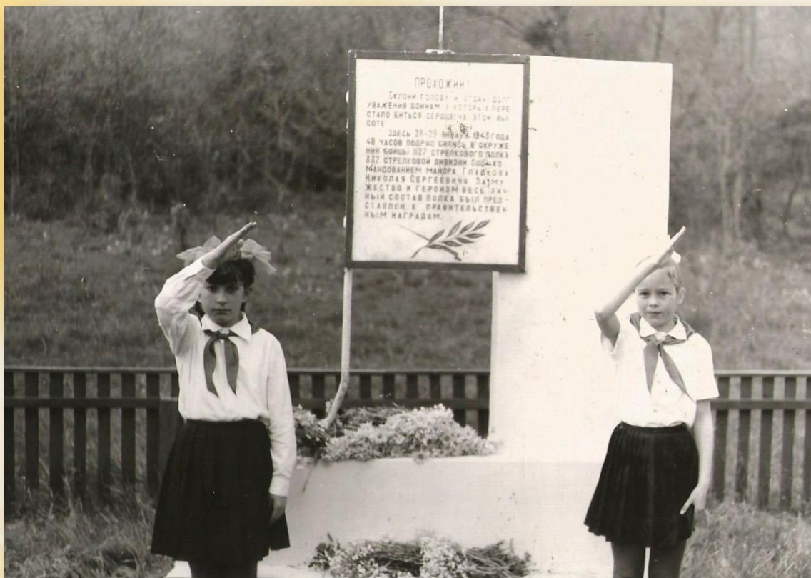
Место гибели 1127 стрелкового полка