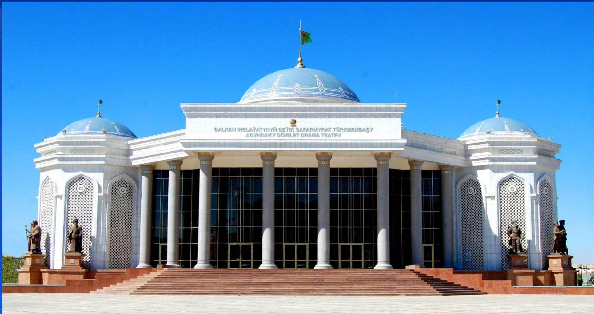
Здания Государственного драматического театра