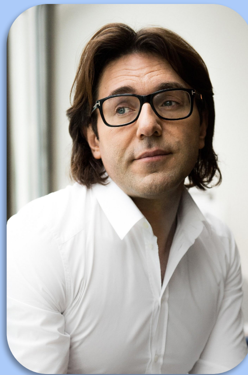
Андрей Малахов в