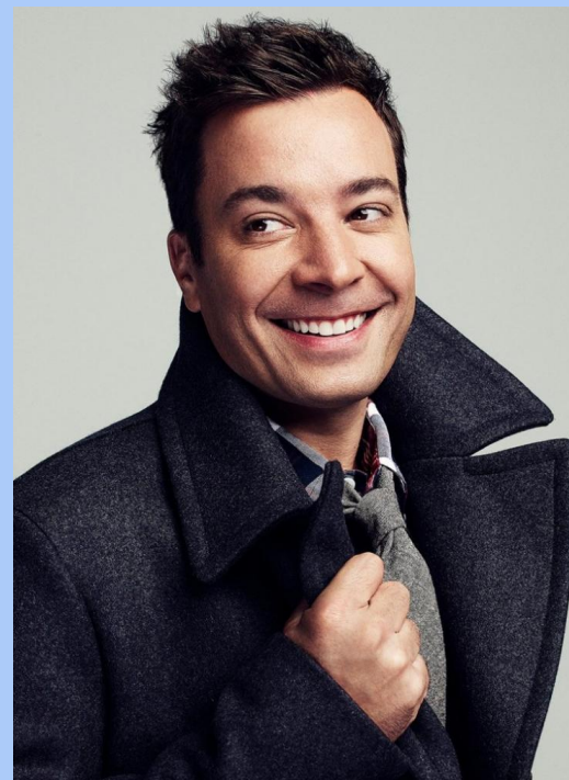
Джимм и Фэллт он