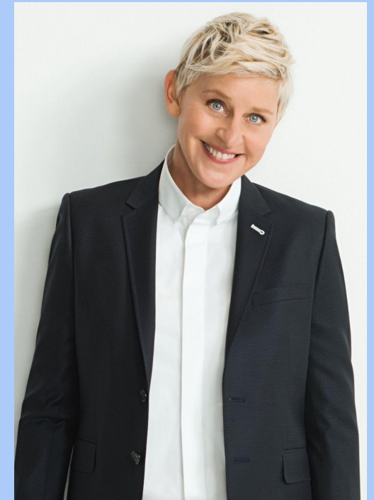
Эллен Дедженер ес