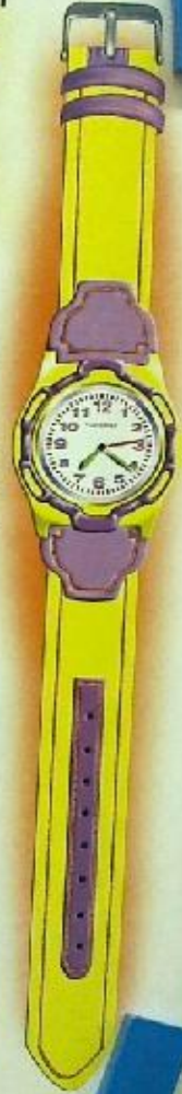
НАРУЧНЫЕ МЕХАНИЧЕСКИЕ ЧАСЫ