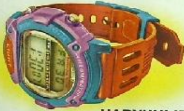
НАРУЧНЫЕ ЭЛЕКТРОННЫЕ ЧАСЫ