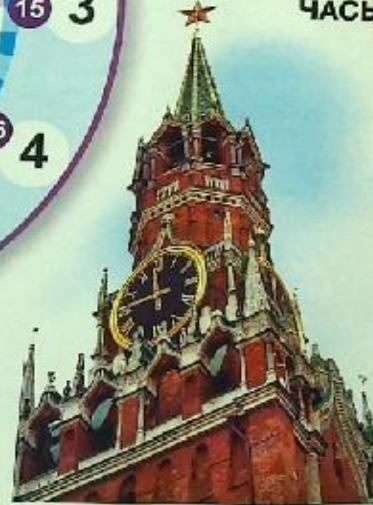
ЧАСЫ НА БАШНЕ

1 СУТКИ = 24 ЧАСА 1 ЧАС = 60 МИНУТ 1 МИНУТА = 60 СЕКУНД