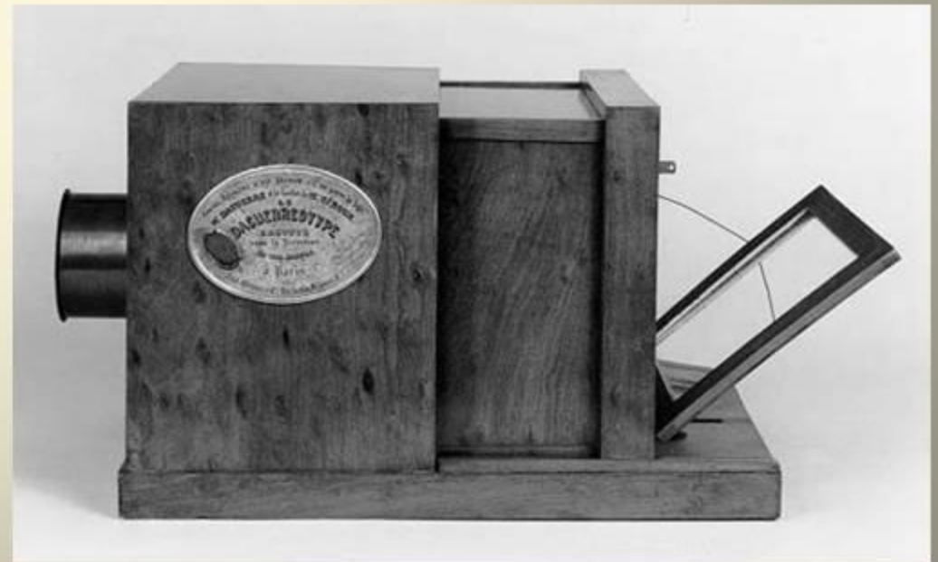
Камера - обскура

В 1839г. Ж.Дагер совместно с Ньепсом и Тальбо совершил открытие фотографии. Усовершенствование фотографии в 1871г. - Медиоксом, в 1878г. – Беннетом.