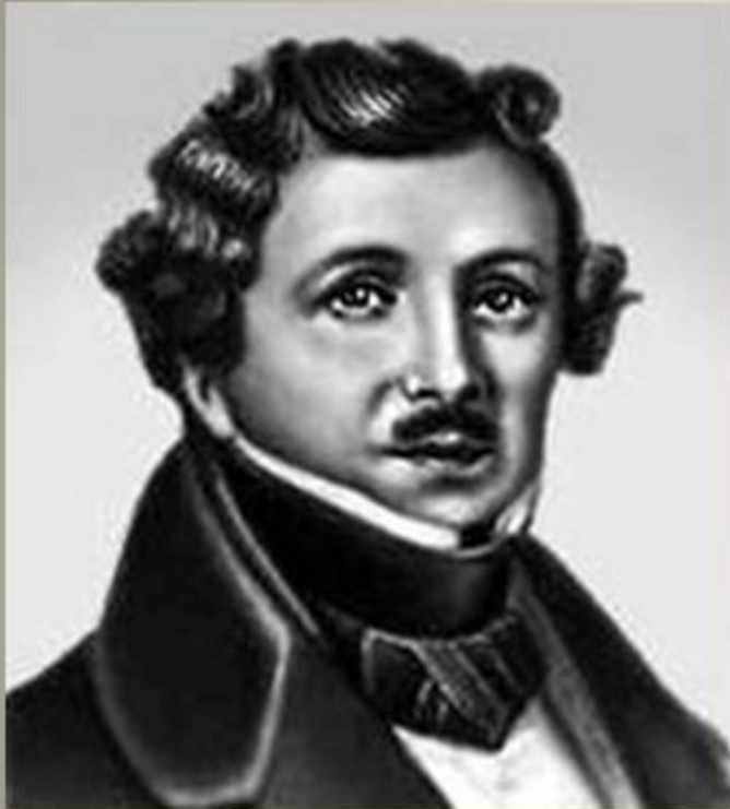
Французский художник Луи - Жак Манде Дагер

В 1839г. Ж.Дагер совместно с Ньепсом и Тальбо совершил открытие фотографии. Усовершенствование фотографии в 1871г. - Медиоксом, в 1878г. – Беннетом.