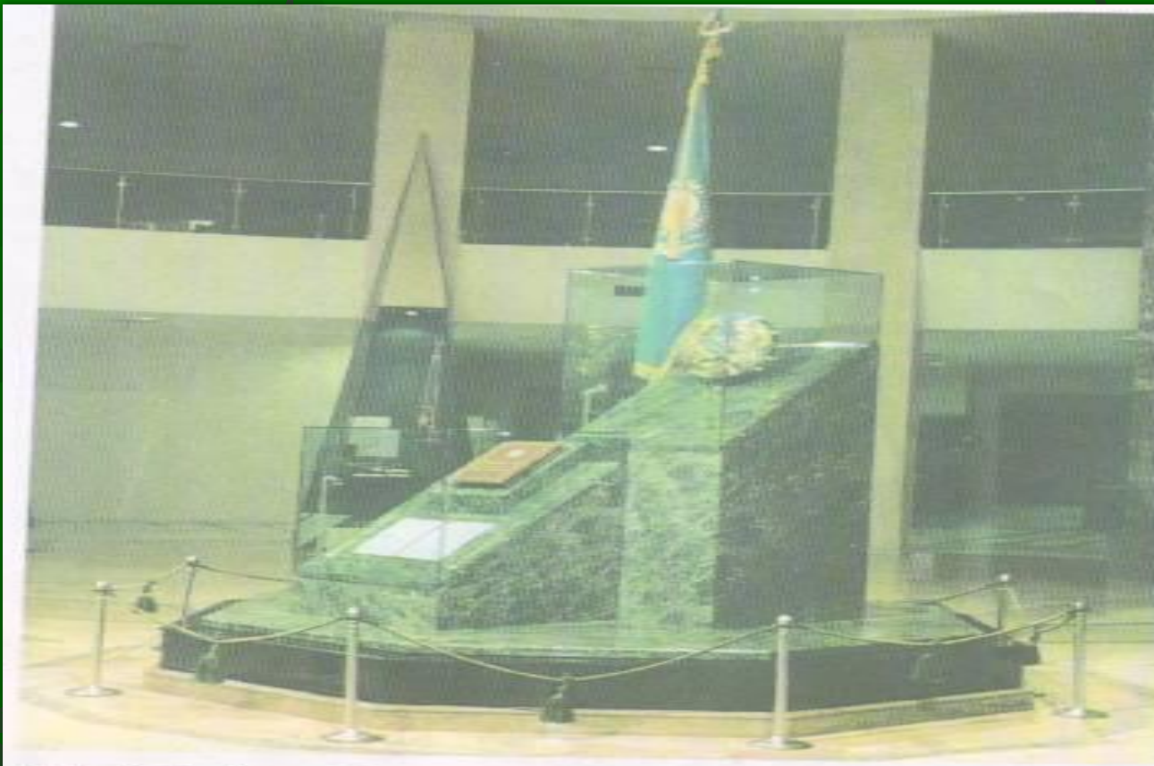
Еліміздің Туы, Елтаңбасы, Әнұраны, Конституциясы қойылған орын. ҚР Президенттік мәдениет орталығы.

1992 жылы 4-маусымда жаңа мемлекеттік рәміздер: Елтаңба, Ту, Әнұраны бекітілді.