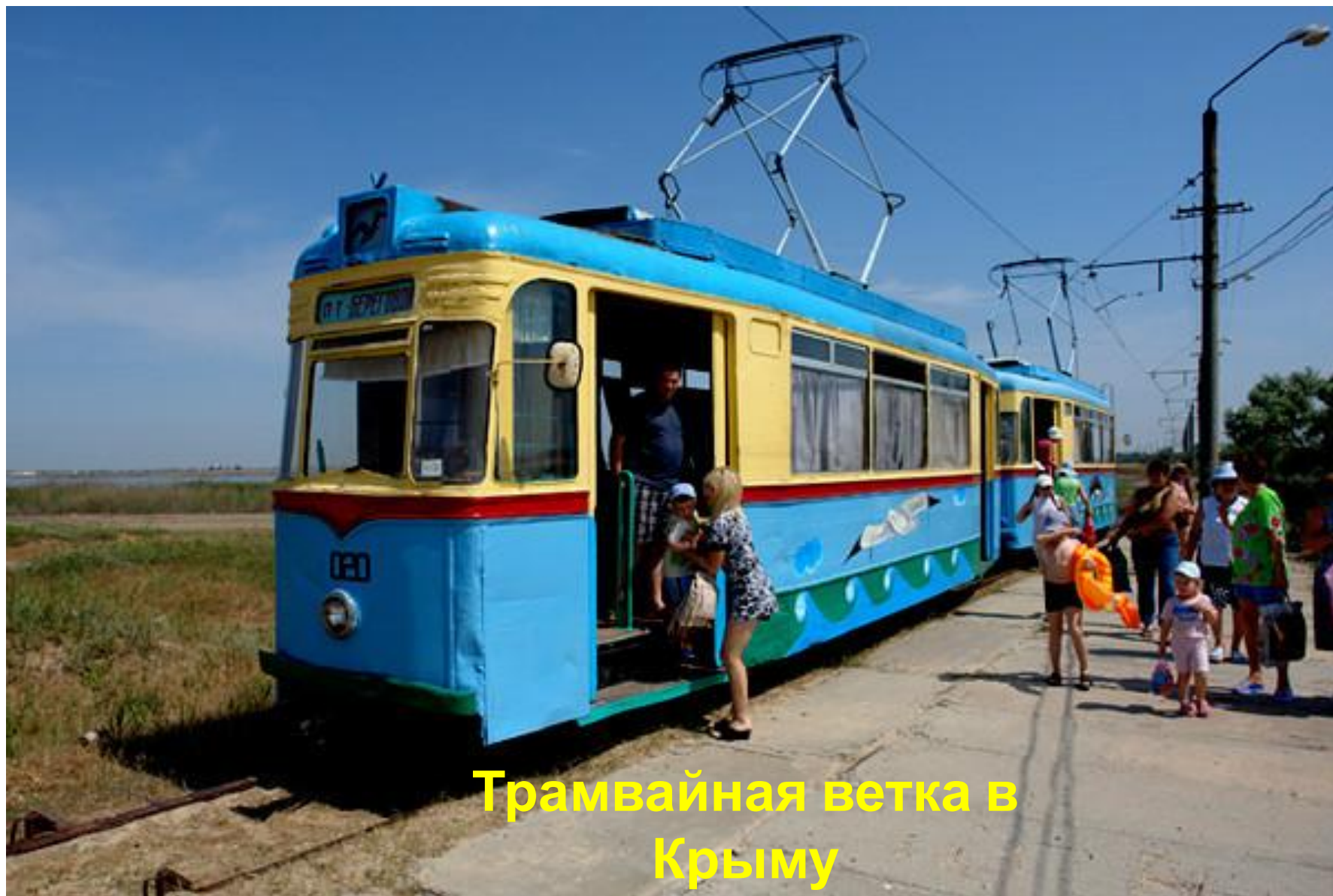
Трамвайная ветка в Крыму