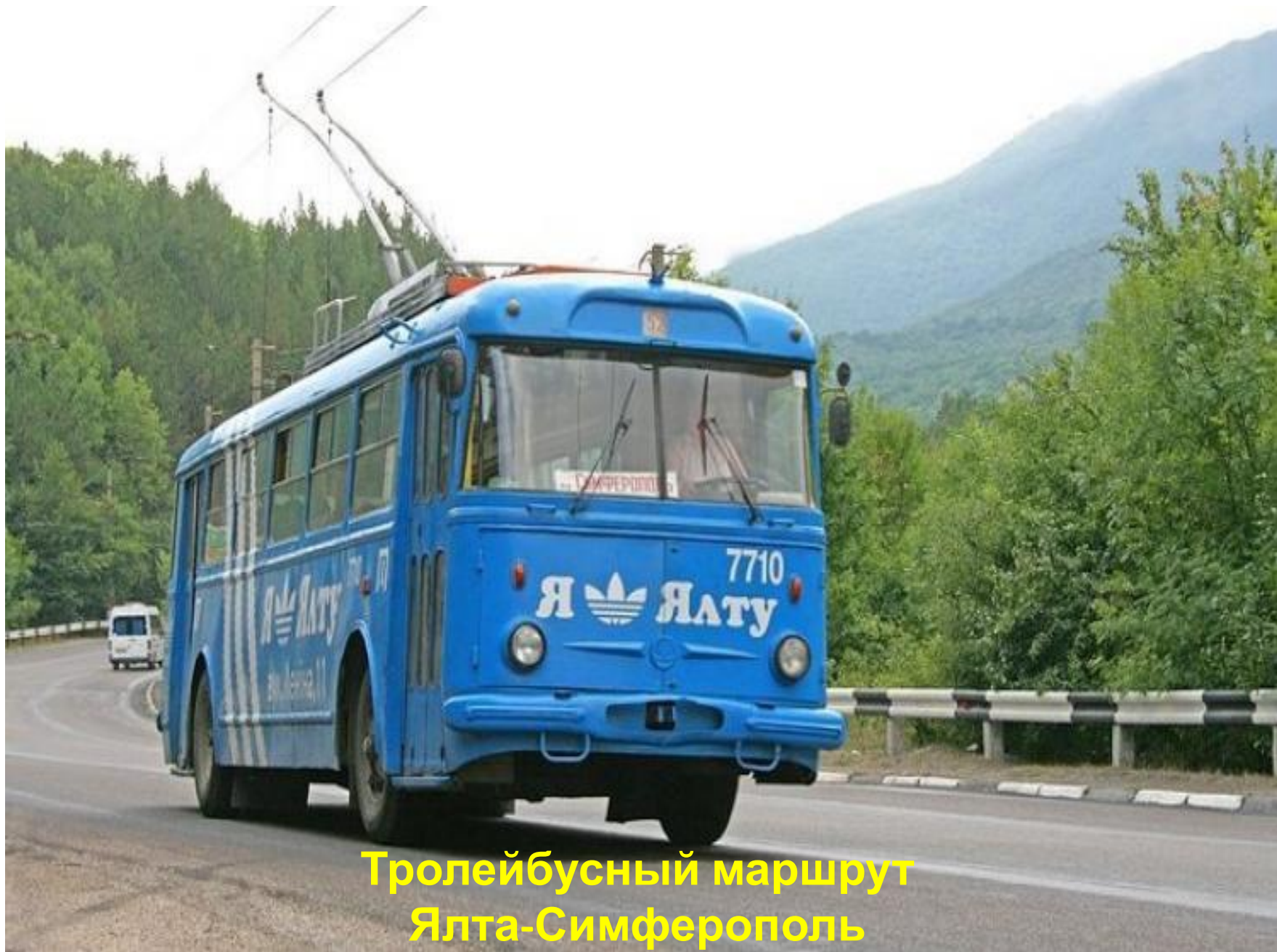
Тролейбусный маршрут Ялта-Симферополь