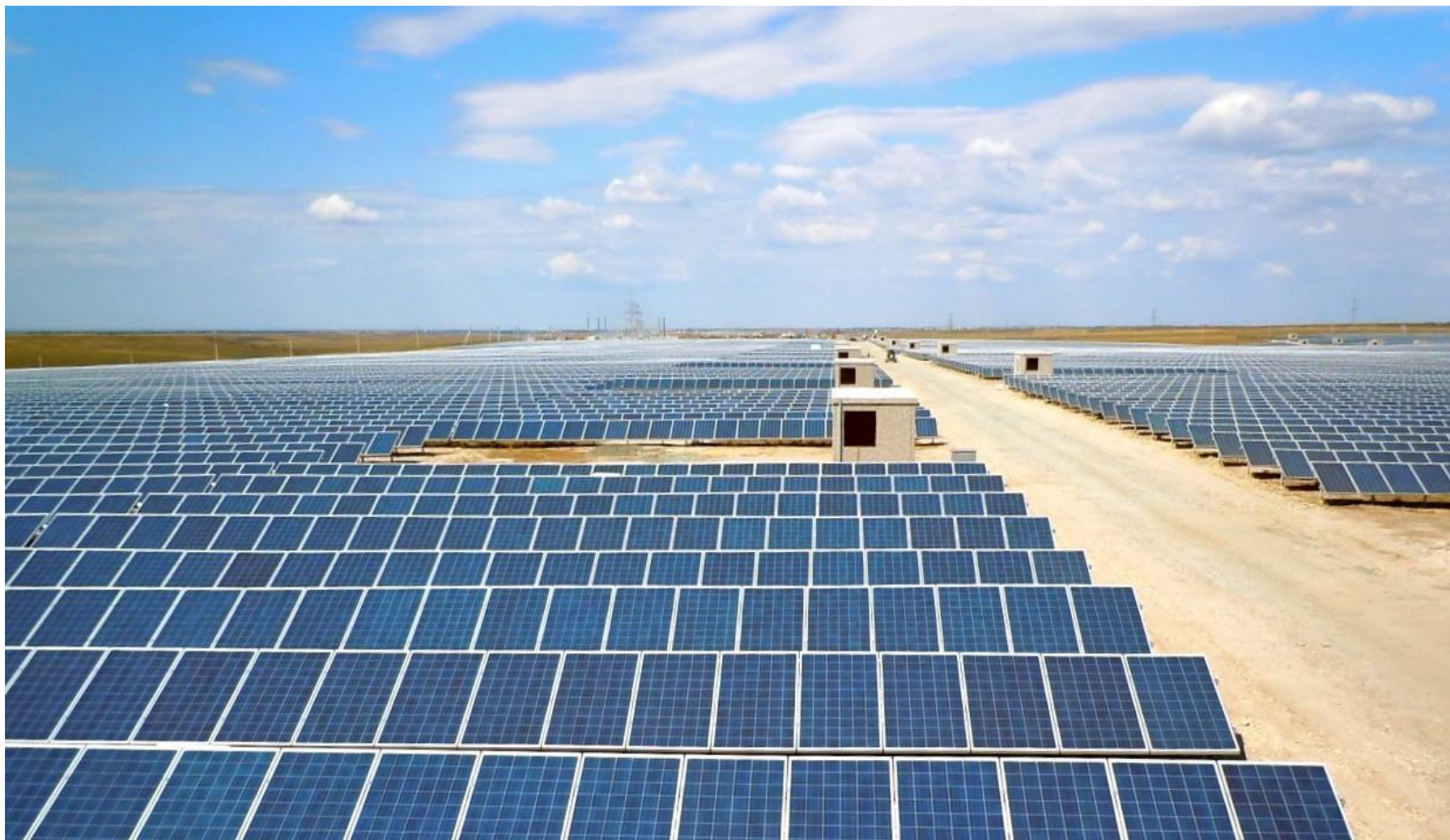
Солнечная электростанция с. Петрово