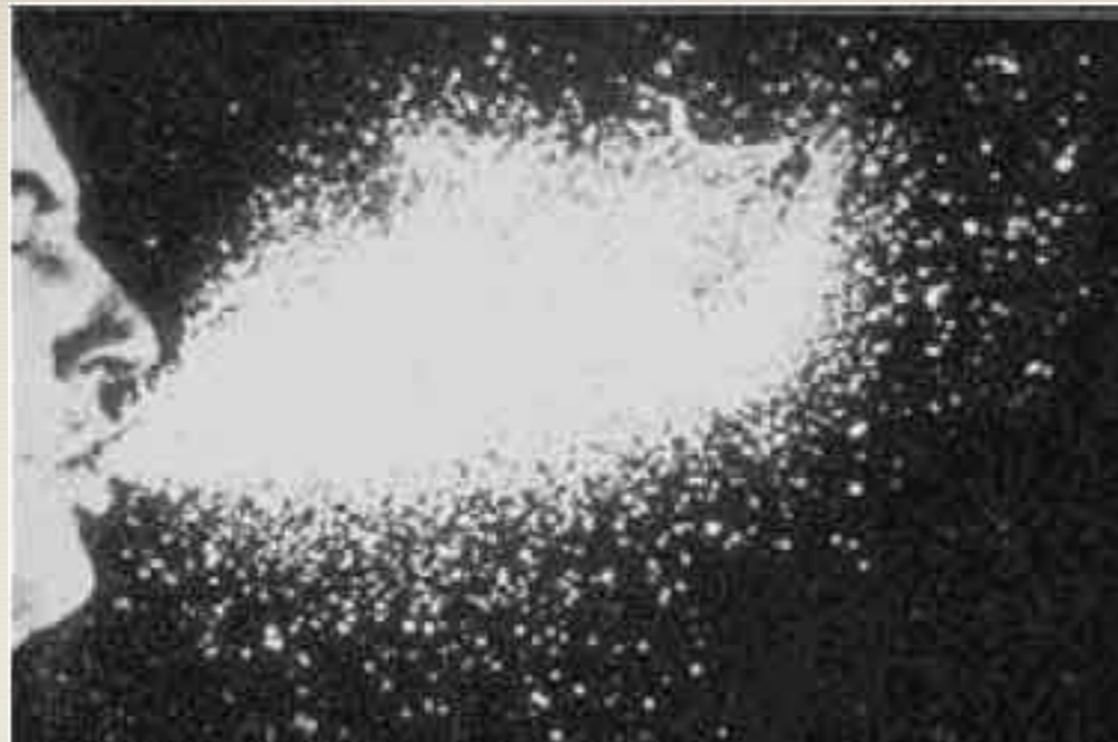
Рассеивание аэрозольных частиц при чихании

Резервуаром вируса и источником инфекции, как правило, является больной человек, возможно, вирусоноситель. Условия формирования вирусоносительства мало изучены. Известно, что фактором, который способствует персистенции вируса, является иммунодефицитное состояние хозяина. В последние годы не исключается также возможность развития хронической гриппозной инфекции. Последние вспышки гриппа (например, в Гонконге) дают основания предполагать, что возможна передача вируса типа А от животного к человеку.