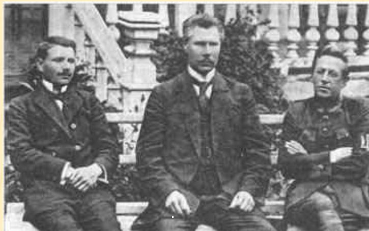
Федір Швець (у центрі), Андрій Макаренко та Симон Петлюра в Кам'янці-Подільському. 1919 рік