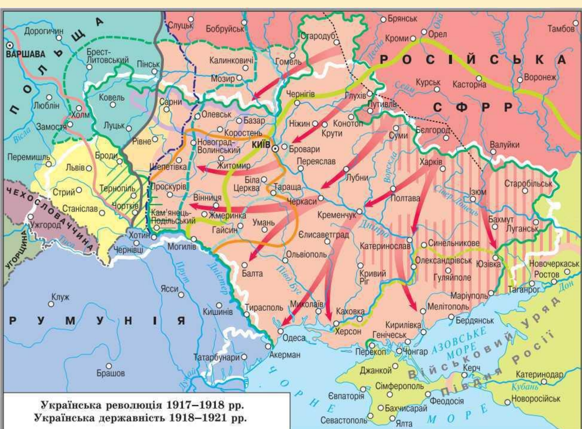
Українська революція 1917–1918 рр. Українська державність 1918–1921 рр.