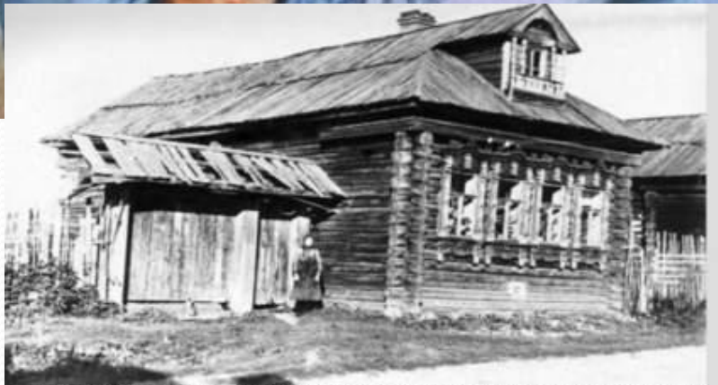
«Матренин двор». Солженицын не случайно так назвал свое произведение. Это один из ключевых образов рассказа. Описание двора, подробное, с массой деталей, лишено ярких красок: Матрена живет «в запущи». Автору важно подчеркнуть неразрывность дома и человека: разрушат дом — погибнет и его хозяйка.